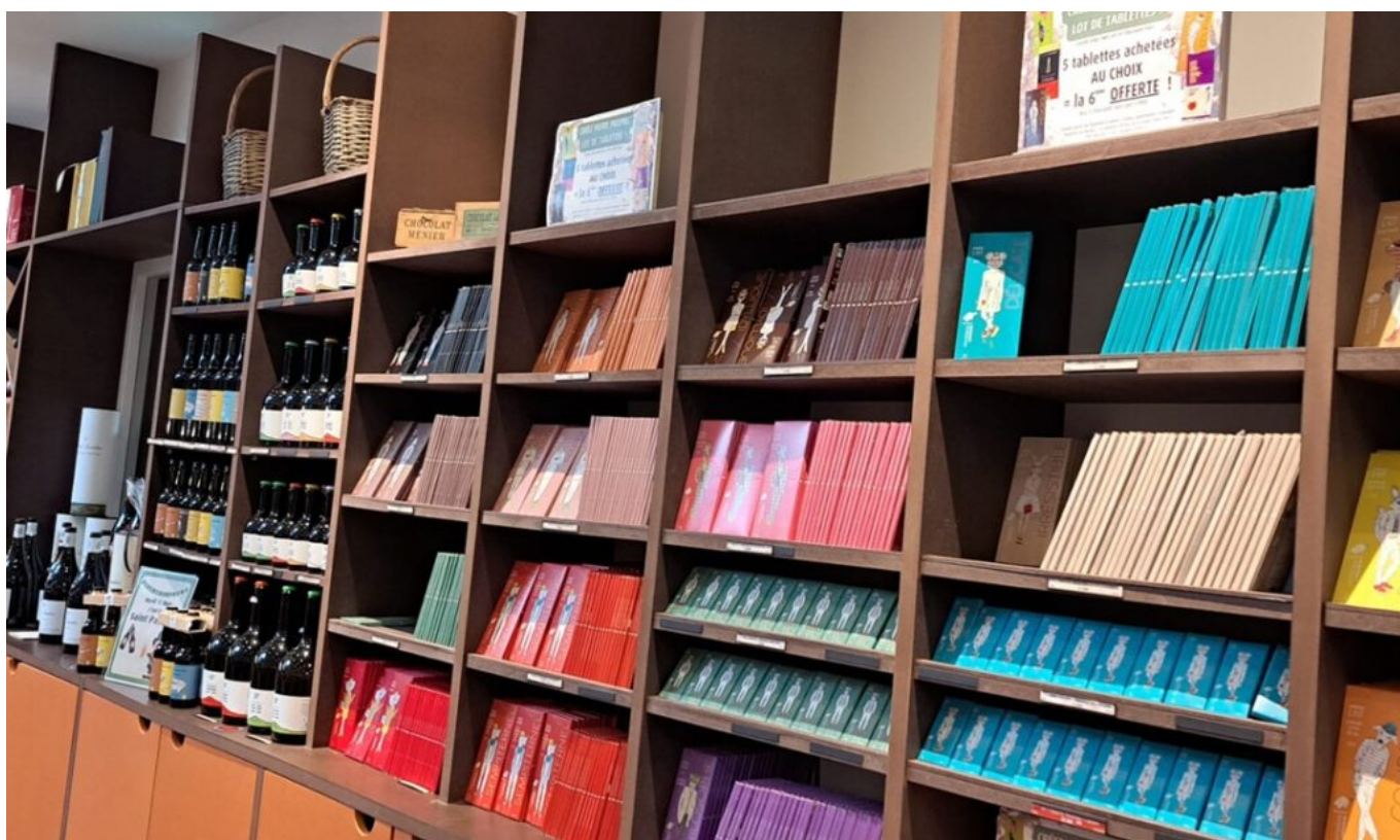
Assortiment de tablettes

Tout au long des rayons, les tentations ne manquent pas. Pâtes à tartiner, tablettes bio, coffrets prestige, ballotins, Palets des Papes au marc de Châteauneuf, noix de cajou enrobées de chocolat, assortiment billes de céréales, sucettes-cœurs, nougates. En plus du sucré, miel, pâte de coing, calissons, nougat, jus de pêche et de poire, biscuits de la maison Le Beau Geste , vin doux naturel de Rasteau, place aussi au salé, chips, terrine de morilles, également huile d'olive du Clos Saint-Michel voisin. Mais aussi bouteilles des domaines viti-vinicoles réputés comme Amadieu de Gigondas, Beaurenard et la Cuvée des Cassagnes de Château La Nerthe à Châteauneuf. En rayon aussi, des bières artisanales fabriquées à Cairanne, Boc , ou à Bouillargues, au Sud-Est de Nîmes, La Barbaude . Sans oublier du thé et du café.