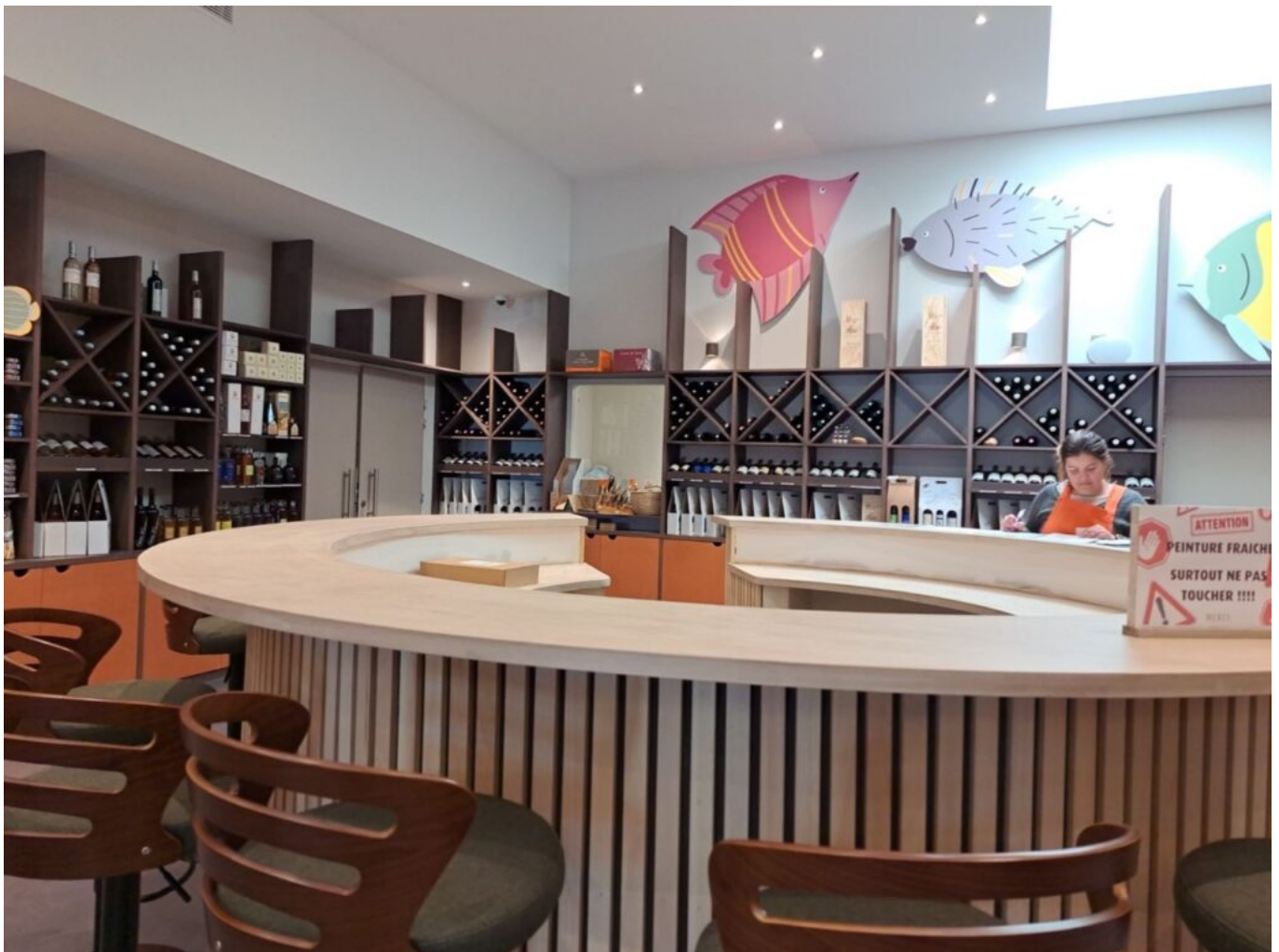
Espace de dégustation des vins