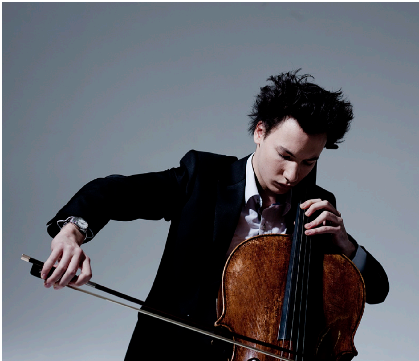
Edgar Moreau