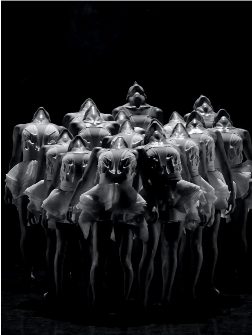
Le Lac des Cygnes.