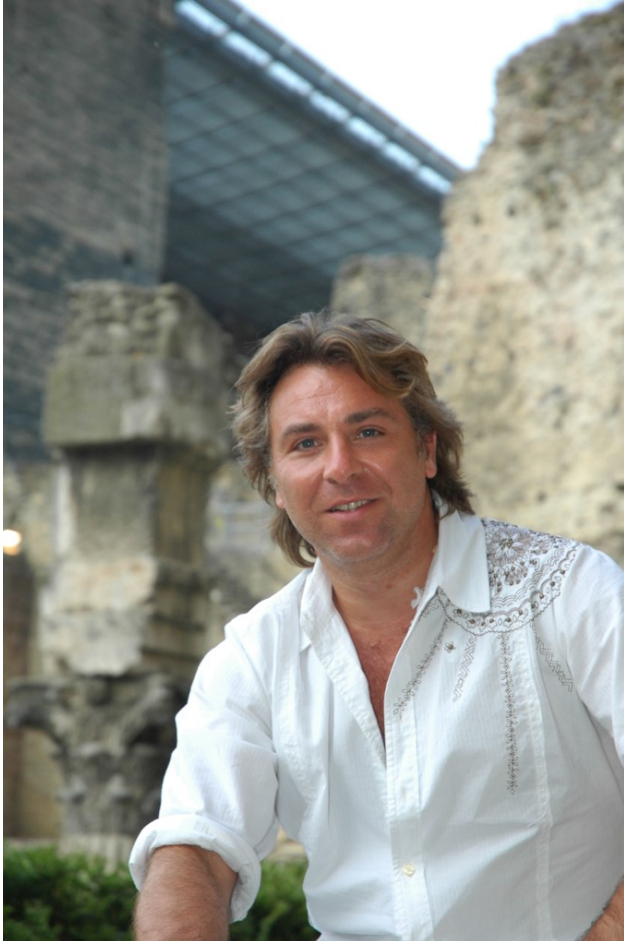
Roberto Alagna devant le théâtre antique d'Orange.

Suivra le jeune violoncelliste Edgar Moreau pour la soirée du 18 juillet : avec l'Intégrale des fameuses 'Suites pour violoncelles' de Bach... 2h 30 de bonheur pour les incondtionnels du maître de chapelle du Duc de Saxe-Weimar.