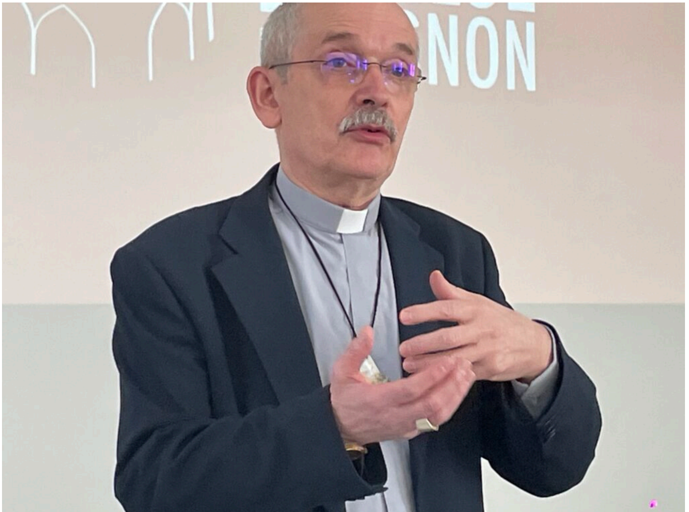
Monseigneur Fonlupt

Ce basculement traduit une mutation profonde : la foi ne se transmet plus automatiquement, elle se choisit. Les profils sont souvent jeunes, entre 25 et 35 ans, en quête de sens face aux épreuves personnelles ou aux incertitudes contemporaines. « On passe d'une logique d'héritage à une logique d'adhésion », souligne l'archevêque.