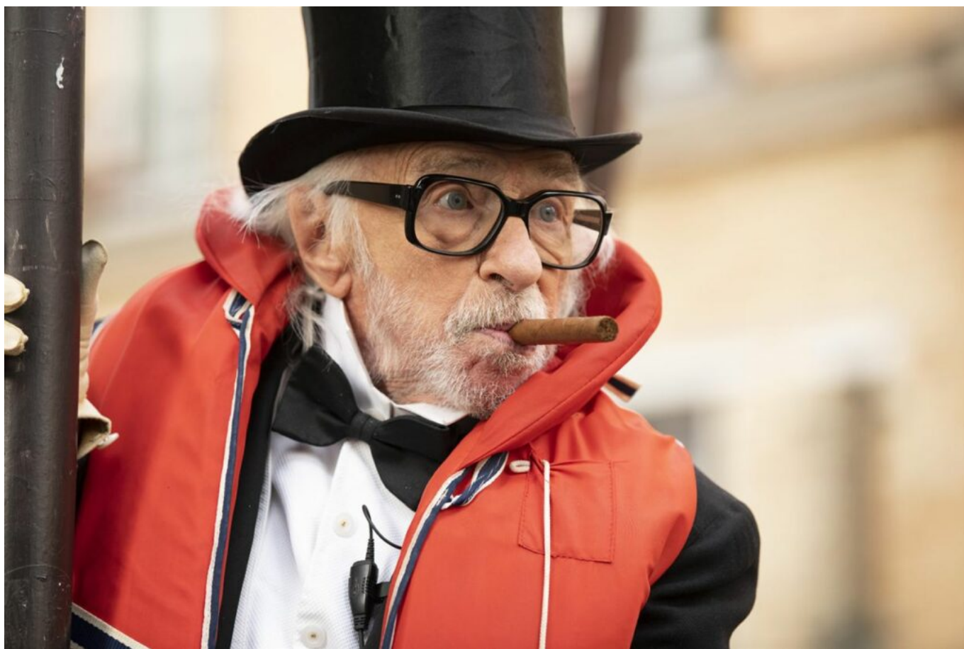
Pierre Richard, Les vieux fourneaux