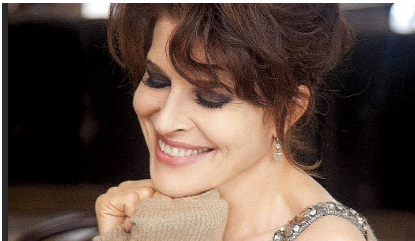
Fanny Ardant