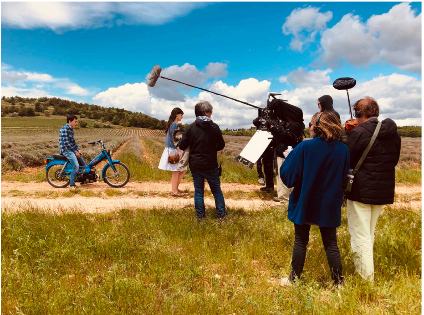
Tournage ' Grand ciel ', juillet 2019

L'attractivité est le maître-mot. « Il ne s'agit pas juste de faire comme les autres, il faut dessiner une stratégie cohérente, inclusive, et s'y tenir. Demain, la production se déroulera sans doute en Paca, au-delà de Marseille, ou potentiellement à Cannes. » La formation encourage par ailleurs la sédentarité avec des débouchés d'emploi et attire par la même occasion d'autres métiers de services.