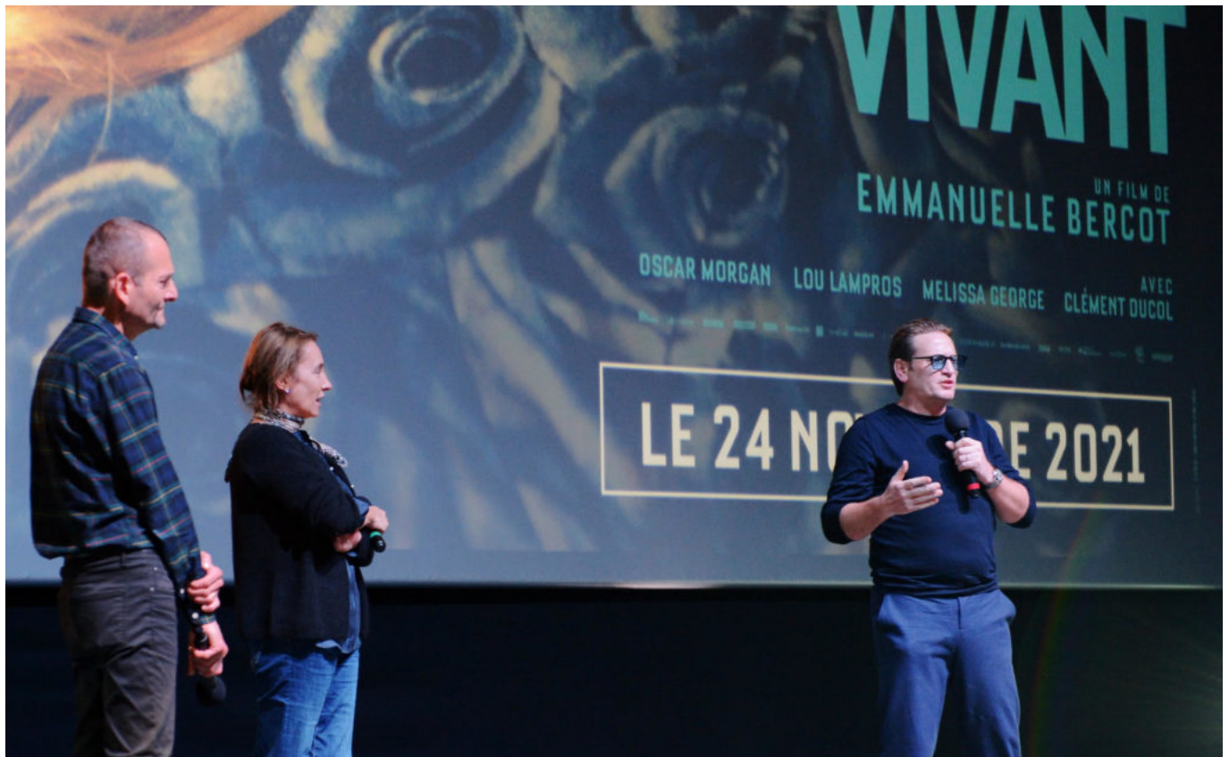
Benoît Magimel et Emmanuelle Bercot pour l'avant-première du film au Capitole studios.

« Elle est très maternelle dans la vie », explique la réalisatrice, « Elle a été bouleversée par le scénario, elle a senti l'épreuve intime que cela allait être. Elle parle même de « sa » maladie, alors que c'est celle de son fils », une mère omniprésente, aimante, de plus en plus impuissante qui finit par accepter l'inacceptable, le départ de son petit, de son poussin avant elle.