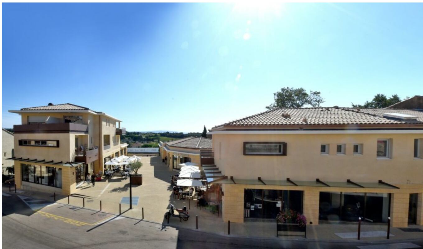
La place Jean-Moulin, nouveau lieu de vie du village.

Mère Germaine qui ne désemplissent pas semaine et week-ends compris, Claude Avril est en train d'implanter un parking supplémentaire végétalisé dans le quartier des Arènes. Objectif ? Désengorger la circulation sur les hauteurs. « Ce seront 220 places avec des caméras de vidéo-protection. Un investissement de plus de 1,3M€ que nous n'aurions pu faire sans l'appui de l'intercommunalité du Pays d'Orange en Provence qui aide un petit bourg comme le nôtre » ajoute-t-il.