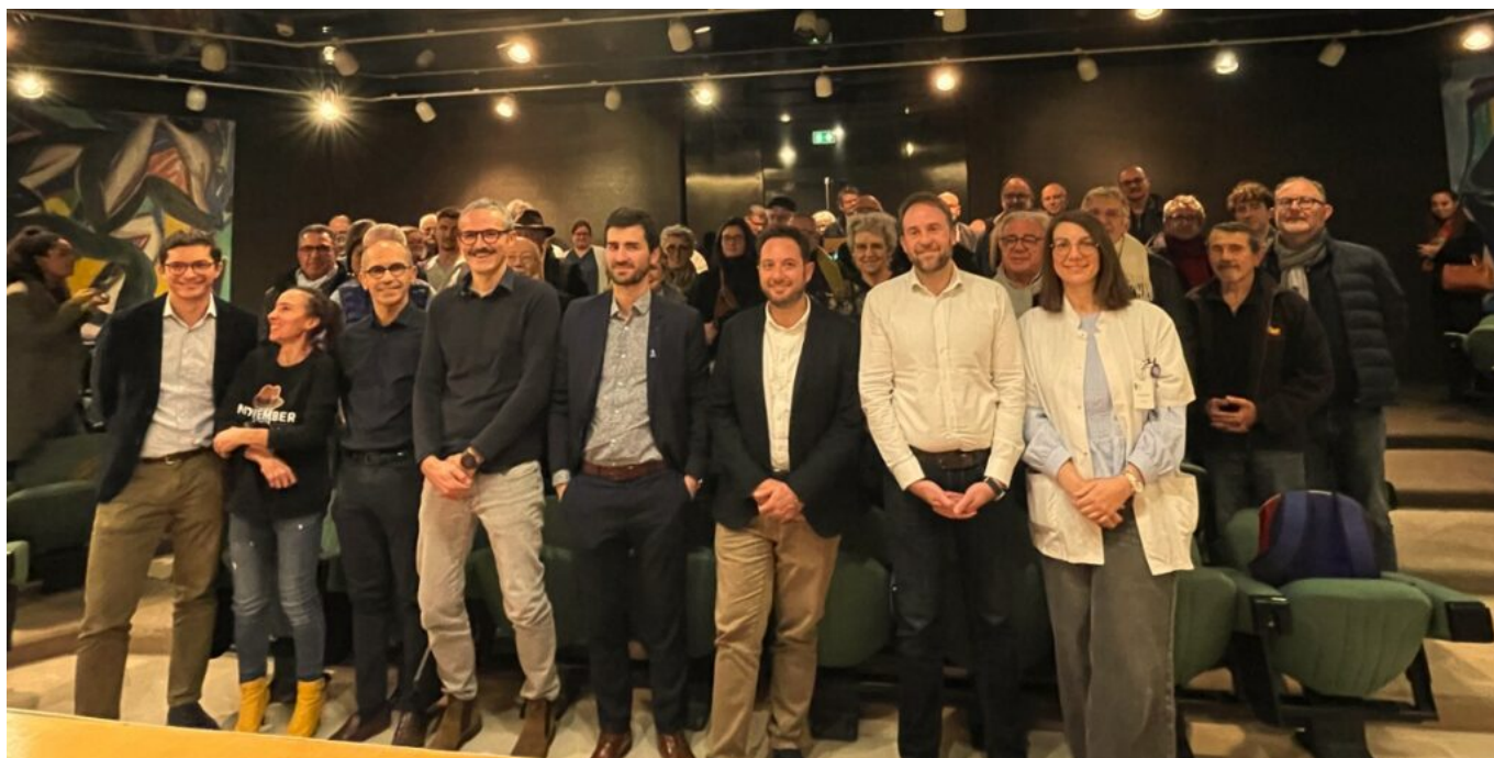
Les conférenciers et derrière eux, le public

Aujourd'hui, en cas de PSA élevé ou de suspicion clinique, le protocole peut comporter une imagerie (IRM), puis - si un nodule suspect apparaît - une biopsie pour confirmer la présence d'un cancer. Cette approche plus nuancée que le dépistage systématique vise à éviter les surdiagnostics et les traitements inutilement agressifs, tout en repérant les formes dangereuses.