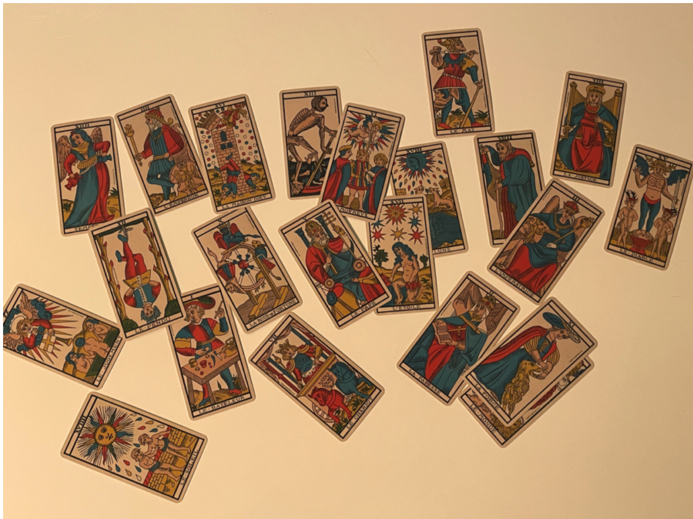
Véritable Tarot de Marseille Copyright MMH