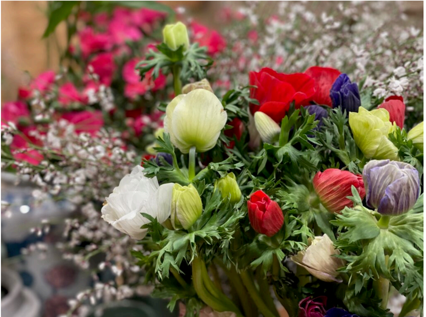
Les fleurs de Lara Hollebecq