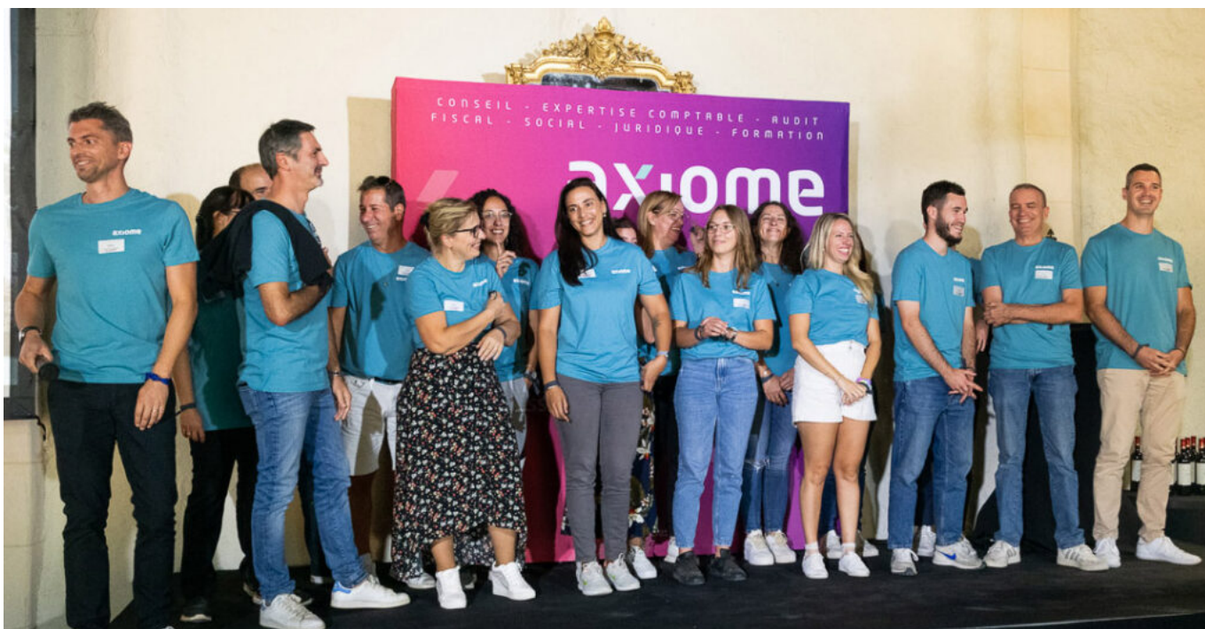
Le groupe Axiome compte 53 associés et près de 350 collaborateurs.