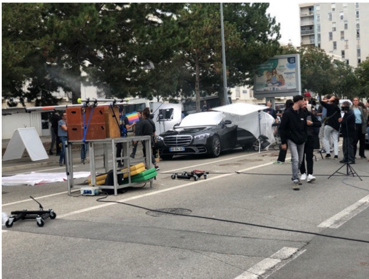
Tournage d'Exquis à Avignon.