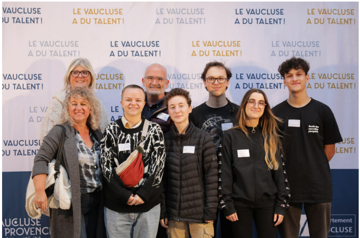
Des étudiants d'écoles vauclusiennes et futurs talents des industries Culturelles et Créatives de Vaucluse