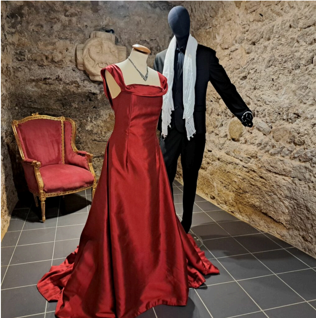
Costumes de La Traviata

On poursuit la visite avec de magnifiques photos du Théâtre Antique et des gradins pleins comme un oeuf pour la version controversée de « La Force du Destin » de Verdi de 1982 avec la diva catalane Montserrat Caballe en tenue paramilitaire de camouflage et rangers, mise en scène par Margarita Walman avec une jeep US sur scène.