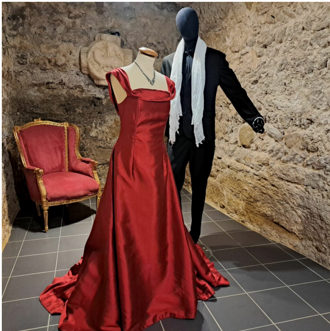
Costumes de La Traviata

On poursuit la visite avec de magnifiques photos du Théâtre Antique et des gradins pleins comme un oeuf pour la version controversée de « La Force du Destin » de Verdi de 1982 avec la diva catalane Montserrat Caballe en tenue paramilitaire de camouflage et rangers, mise en scène par Margarita Walman avec une jeep US sur scène.