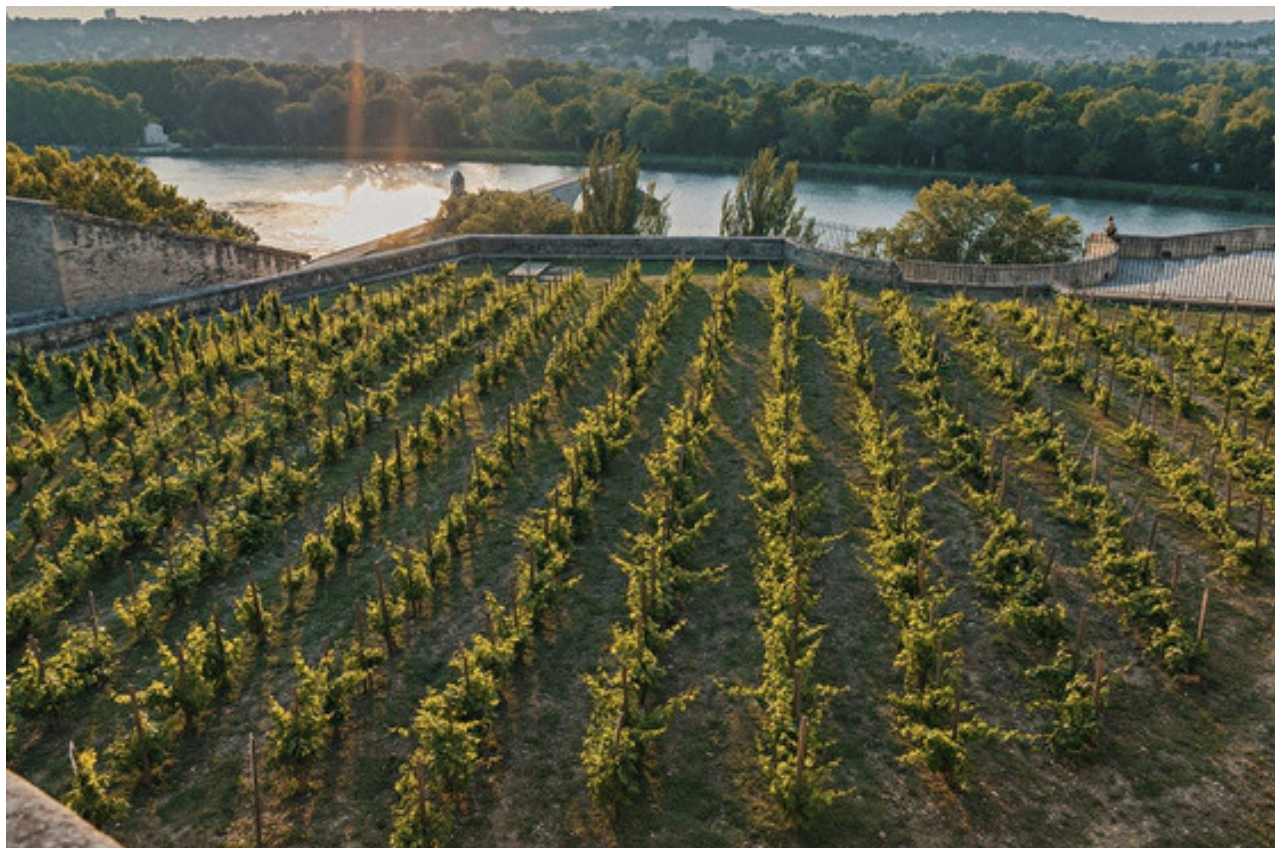
La Vigne du Clos des Papes qui surplombe le Rhône.

Après le Live de samedi, la Balade Gourmande et Vigneronne le samedi 6 juin, le Bar à Vins de Châteauneuf-de-Gadagne lors de Terroirs en Fête les samedi 13 et dimanche 14 juin, celui de la Maison des Vins pendant le Festival de Théâtre en juillet, ce sera le tour du Ban des Vendanges, le samedi 29 août sur l'emblématique Place du Palais des Papes. La bouteille sera sérigraphiée par l'entreprise de Serge Rossi à Sorgues. « On en vend environ 5 000 lors de la soirée du Ban, les vigneronns touchent 1€ par col. Un tiers de ces bouteilles est ramené à la maison par les participants, en souvenir, où elles servent de carafes », précise David Bérard.