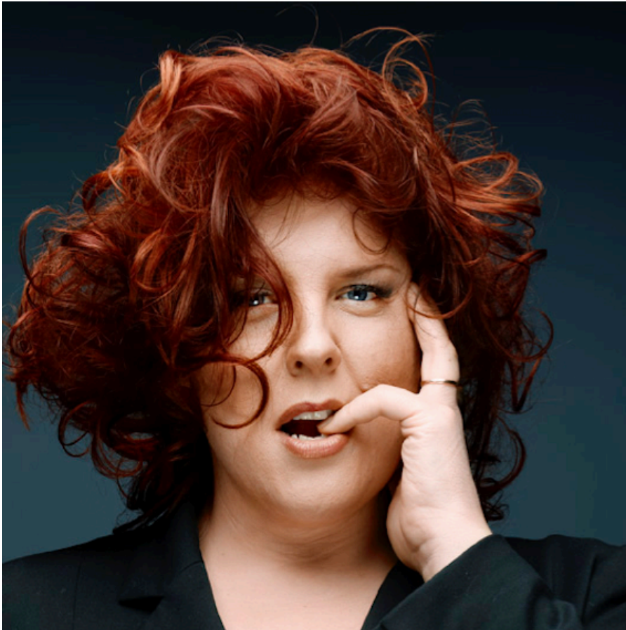
Marie-Nicole Lemieux.