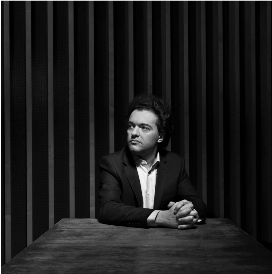
Le pianiste russe Evgeny Kissin.

Comme les Chorégies sont éclectiques et souhaitent chaque année élargir leur audience, elles proposent aussi de la danse le 16 juillet avec le Ballet de la Scale de Milan dont le programme n'est pas encore défini. Du jazz, le 18 avec Eastwood fils, Kyle qui rendra hommage à son papa en interprétant avec son quintet des versions revisitées des bandes originales de films avec saxophone, trompette, contrebasse, guitare basse et batterie.