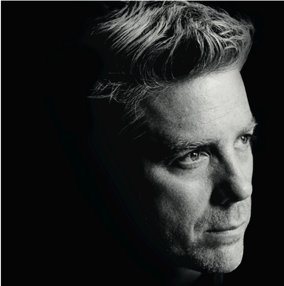
Kyle Eastwood.