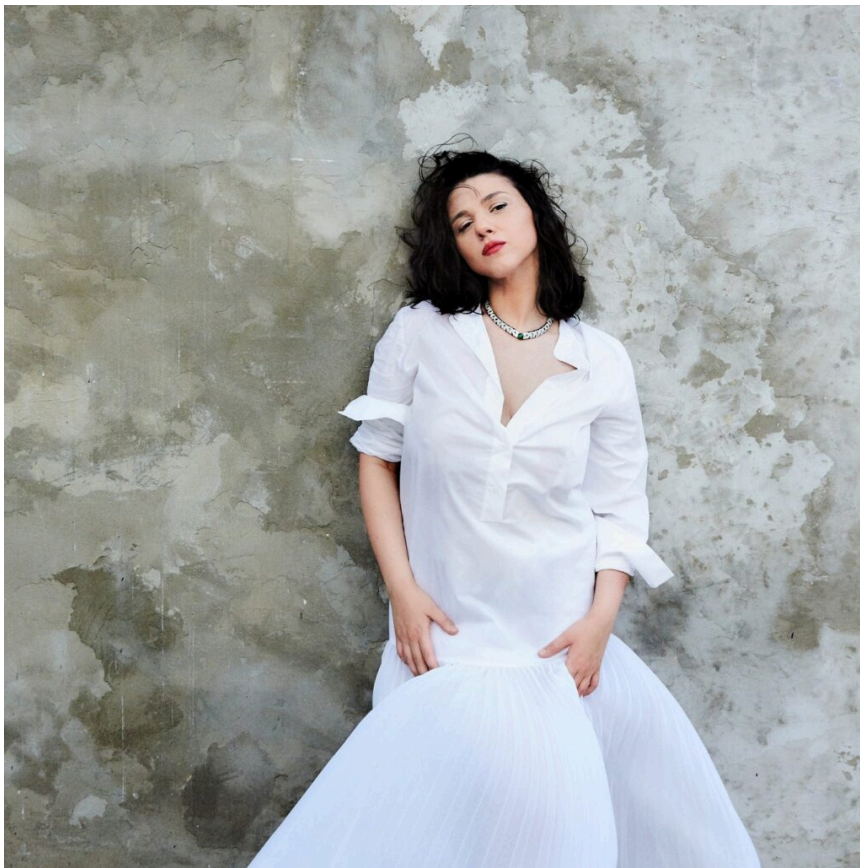
Khatia Buniatishvili.

Mais 2023 sera à coup sûr sublime ! Avec dès l'ouverture, le 2 juillet, une icône, une véritable rock-star du piano, Khatia Buniatishvili qui a donné son 1er concert à l'âge de 6 ans. Elle a remporté le Grand Prix Horowitz à Kiev en 2033 puis le Prix du Public au Concours Arthur Rubinstein en 2008. Depuis, elle parcourt la planète pour une carrière internationale et elle viendra pour la 1ère fois aux Chorégies interpréter l'émouvant Concerto pour piano n° 23 de Mozart.