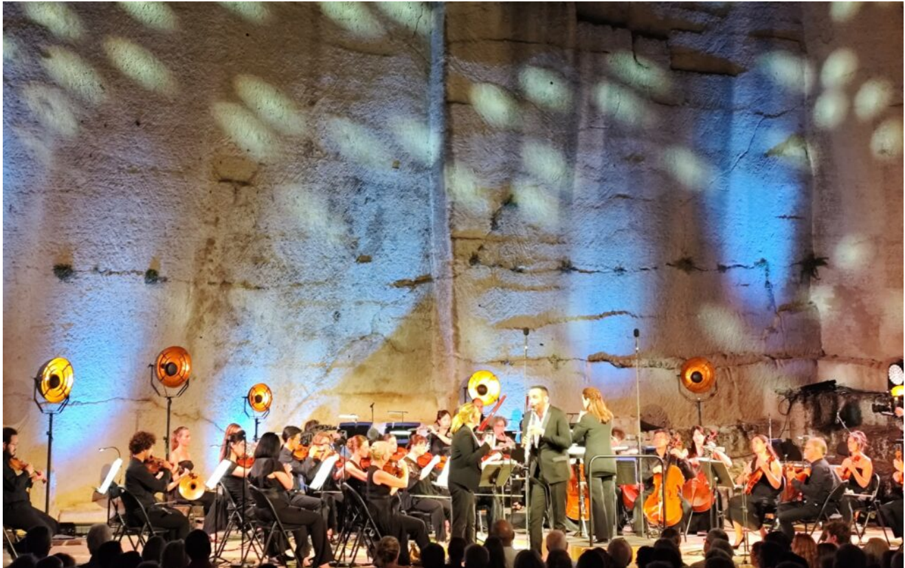
L'Orchestre national Avignon-Provence en concert aux Taillades.