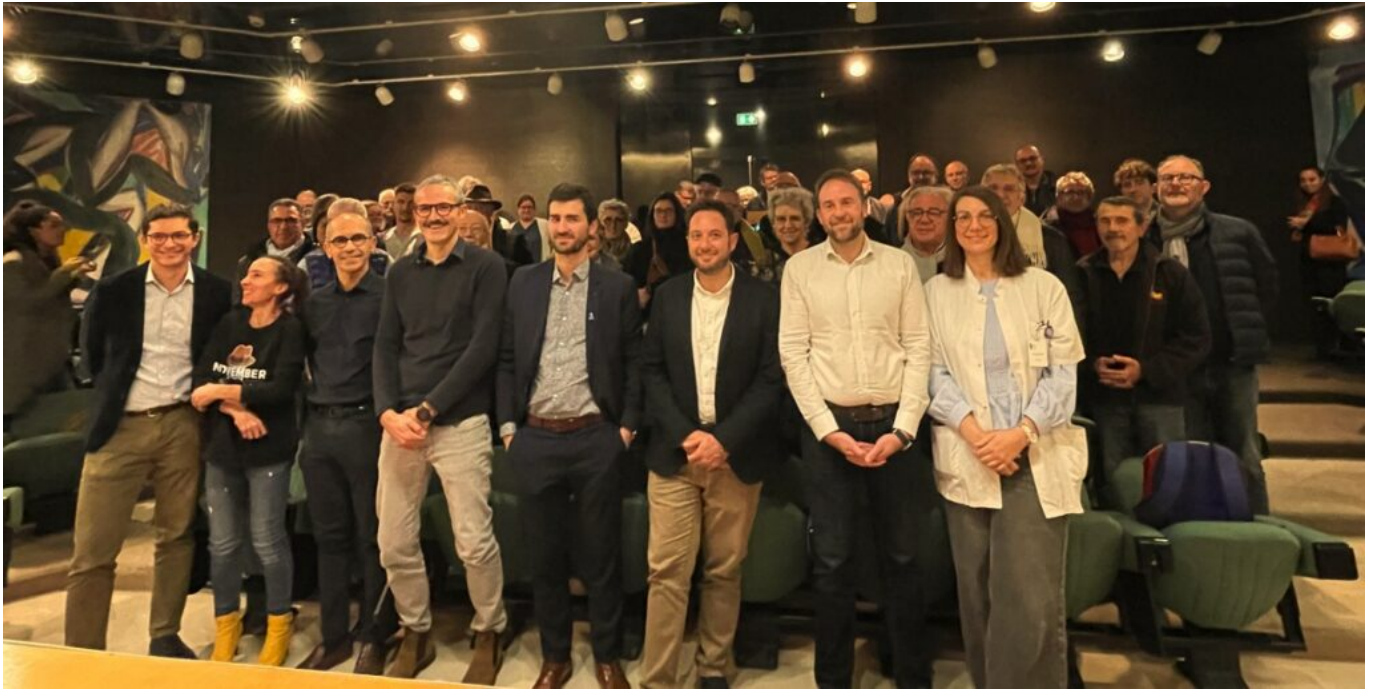
Les conférenciers et derrière eux, le public

Aujourd'hui, en cas de PSA élevé ou de suspicion clinique, le protocole peut comporter une imagerie (IRM), puis - si un nodule suspect apparaît - une biopsie pour confirmer la présence d'un cancer. Cette approche plus nuancée que le dépistage systématique vise à éviter les surdiagnostics et les traitements inutilement agressifs, tout en repérant les formes dangereuses.