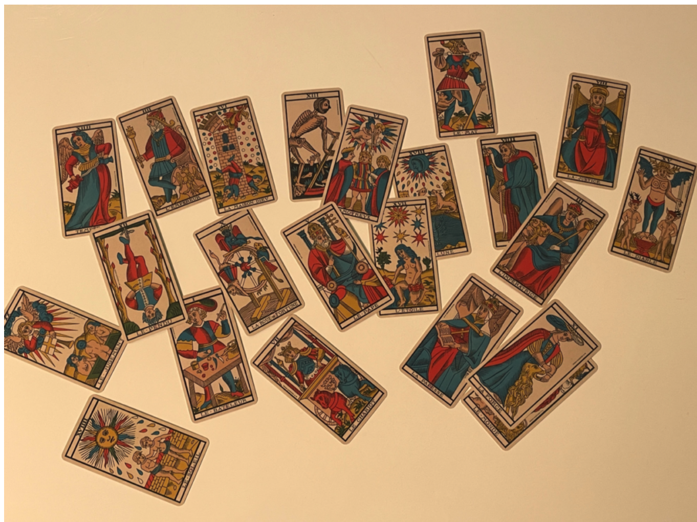
Véritable Tarot de Marseille Copyright MMH