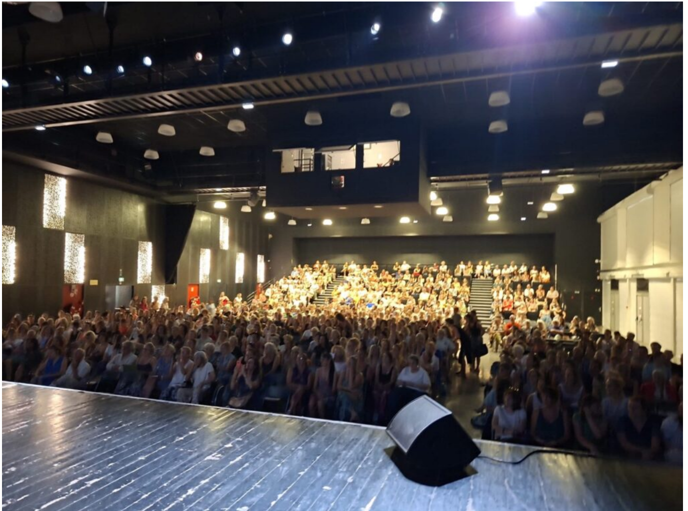
La salle polyvalente de Montfavet était comble pour l'occasion.

Il continue : « C'est cela la résilience, la reprise d'un nouveau développement après un traumatisme. Mais seul on n'y arrive pas, il faut un élan pour avancer, un soutien. Retrouver un sens pour se remettre à vivre, mais autrement. Et mon métier c'est justement d'aider les gens à trouver ce chemin. »