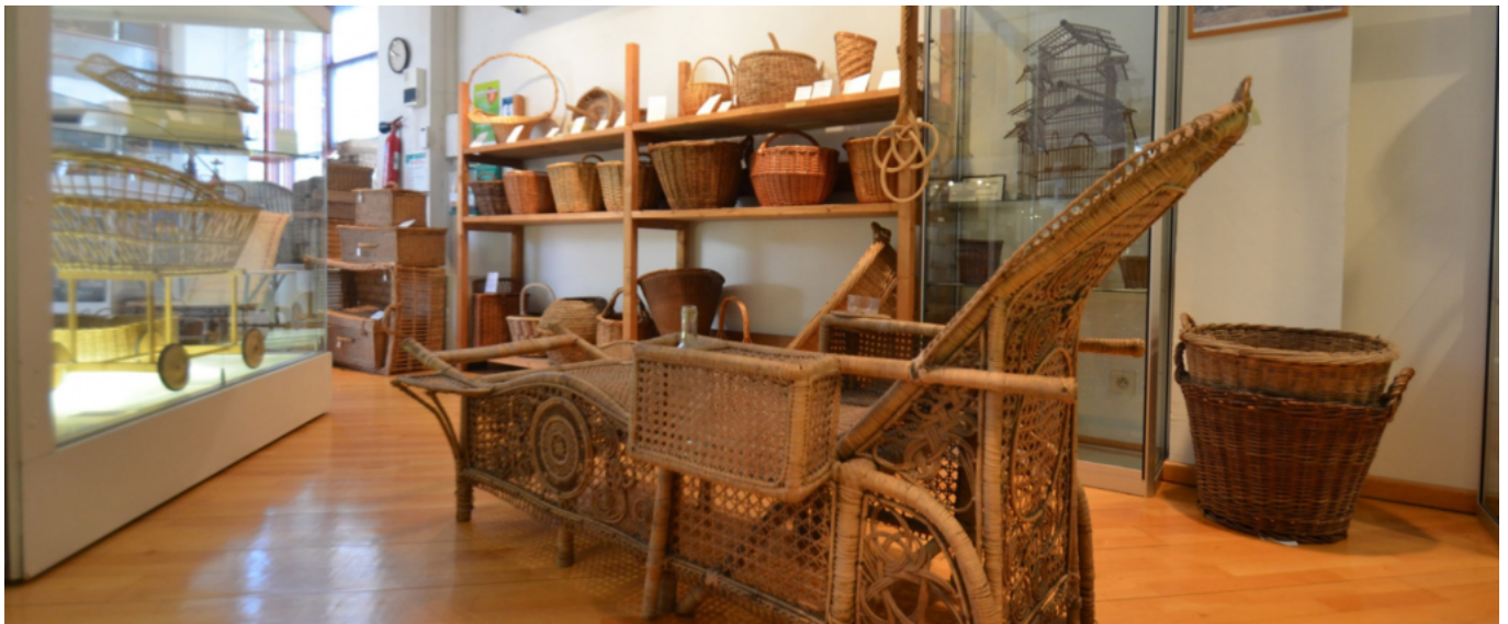
Musée de la vannerie à Cadenet

Samedi et dimanche de 14h à 17h. Entrée libre du musée : samedi et dimanche de 11h à 13h et de 14h à 18h. Avenue Philippe de Girard à Cadenet. Renseignements au 04 90 68 06 85.