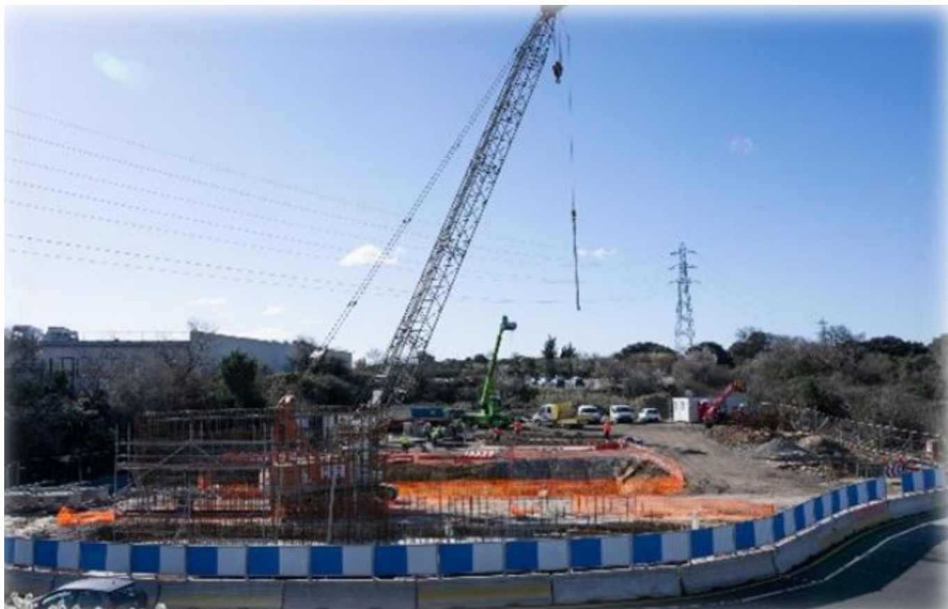
Franchissement de la route de Jonquières

L'année 2025 va également être consacrée à la finalisation des terrassements, à l'assainissement pluvial et au déplacement des réseaux sur la section 2, entre les Crémades et la route de Camaret. La mise en service des carrefours giratoires des Crémades et de la route de Camaret, actuellement en travaux, est envisagée pour la rentrée de septembre. La liaison entre ces deux giratoires sera mise en service courant 2026.