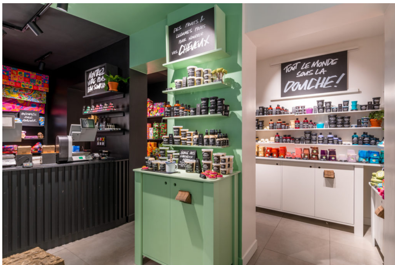
Boutique Lush Boulogne-Billancourt, illustration.

La clientèle qui affectionne particulièrement les produits sans emballage (qui représentent plus de la moitié des ventes), aura la possibilité de peaufiner sa routine zéro déchet ou vegan grâce à l'expertise des équipes en boutique. Un univers à rebours de la cosmétique traditionnelle qui, selon les chiffres, ne cesse de conquérir des adeptes. Implanté dans 48 pays avec 928 points de vente et plus de 9000 collaborateurs, Lush affichait en 2019 un chiffre d'affaires de 1139 millions d'euros.