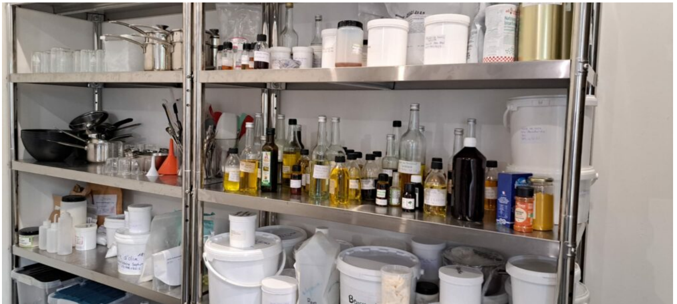
L'atelier-laboratoire de l'ECBF.

Pendant près de 30 ans, Jessica Hamou a appris son métier à Grasse, la capitale du parfum, chez Probionat à La Fare les Oliviers et à Manosque là où est installée L'Occitane. Et aujourd'hui, après avoir appris patiemment dans ces laboratoires d'huiles essentielles et d'extraits de plantes et de fruits, elle transmet avec ces formations certifiées 'Qualiopi'. Déjà, un un an, 70 apprenants sont passés par cet atelier de Montfavet, unique en France.