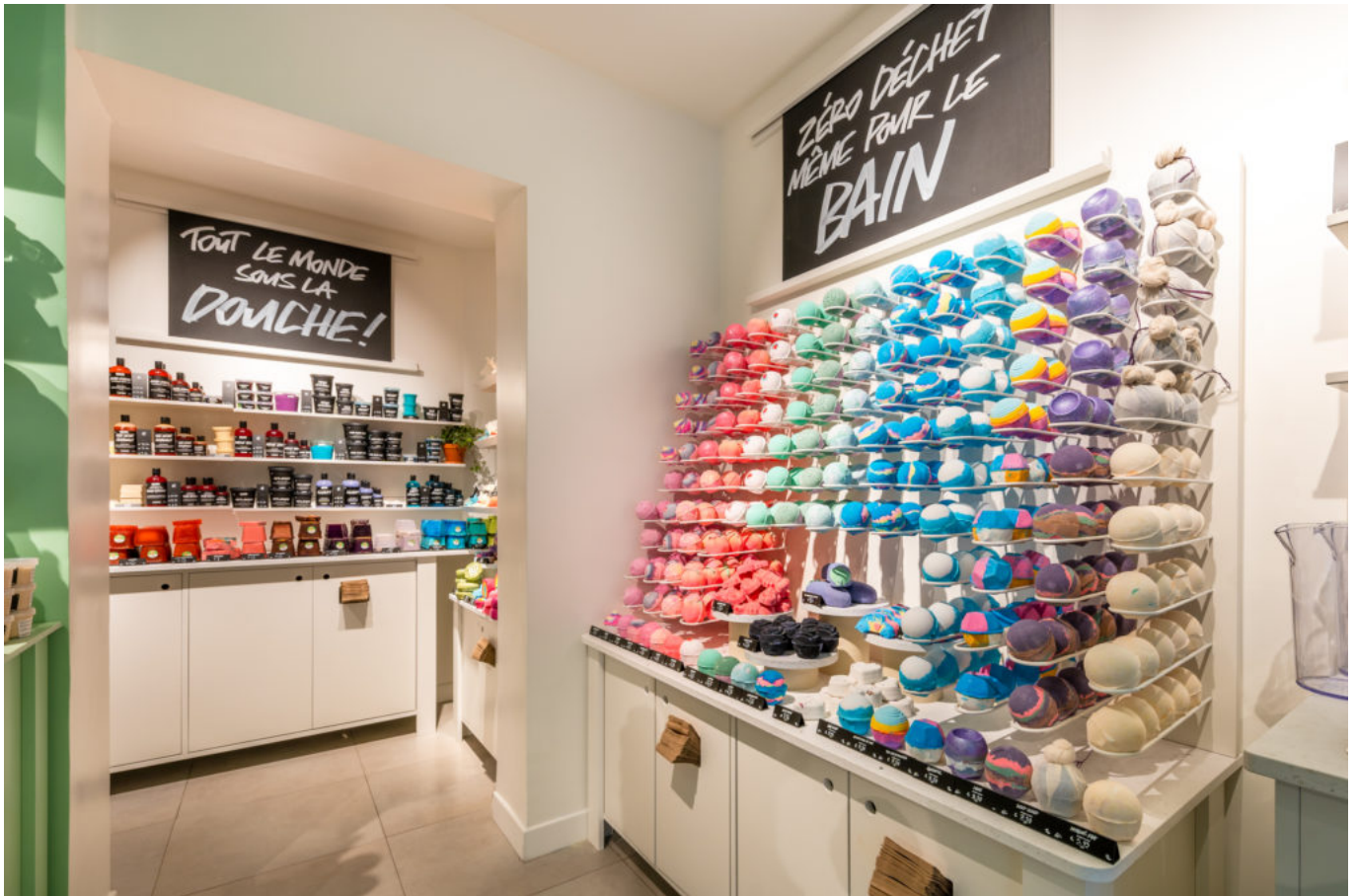
Boutique Lush Boulogne-Billancourt, illustration.

L'enseigne utilise également des plans de travail en plastique recyclé, qui ont été choisis pour s'adapter à l'esthétique des différentes zones. Une stratégie qui se veut innovante et durable à travers le réemploi du mobilier passé. Par ailleurs, la boutique Lush Avignon continue d'être dotée d'un éclairage LED et utilise de l'électricité renouvelable fournie par Planète oui , partenaire de longue date de Lush