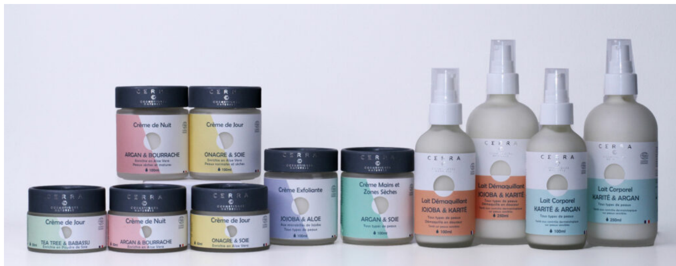
Une partie des produits Cerra.

crèmes de jour, une crème de nuit, un lait démaquillant, un lait pour le corps, un crème pour le corps, un exfoliant pour le corps, de l'huile de jojoba et de l'huile de karité.