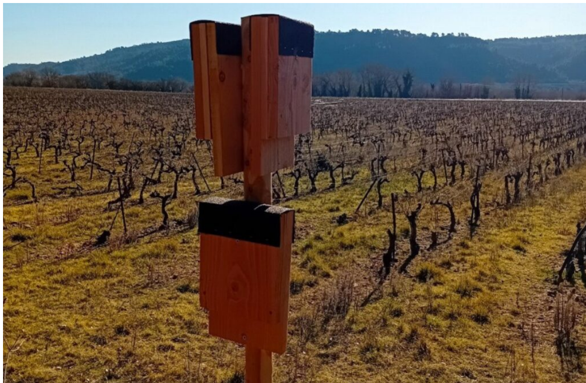
Nichoirs de types fissuricoles sur poteau au sein d'un domaine viticole

biodiversité. L'installation de nichoirs pour les chauves-souris en est un. En plus, les vignerons n'ont pas besoin de s'en occuper. »