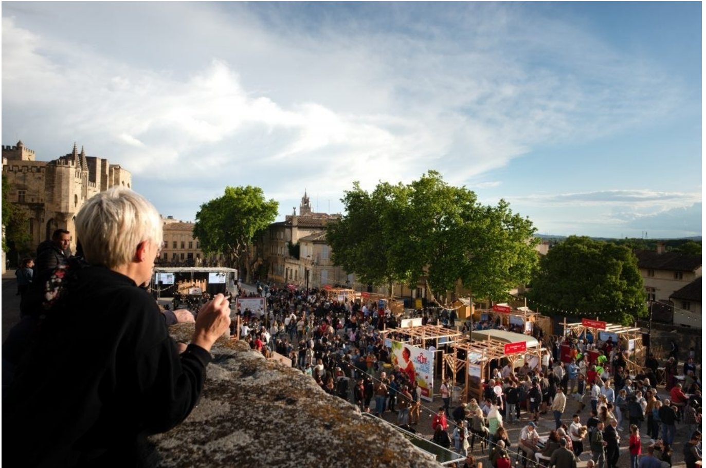
Live des Côtes du Rhône