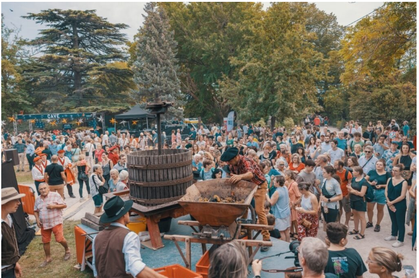
Ban des vendanges

Dans le Vaucluse, des soirées sont prévues à Sablet le 13 juillet, mais aussi Vaison Voit/Boit rouge le 21 juillet, Valréas qui propose avec ses Côtes du Rhône Villages un moment Pink & White avec food trucks et restaurateurs locaux le 23 juillet, et le lendemain, fiesta à Visan. En août, ce sera Sainte-Cécile qui prendra la suite le 2 avec en plus un marché d'artisans. Et notez sur votre agenda que le Ban des Vendanges est programmé le 29 août dans le Jardin des Doms totalement rénové avec de nouvelles plantations, le bassin réaménagé et une aire de jeux pour les enfants. Enfin, le 27 septembre aura lieu le Marathon d'Avignon. Les anciens se souviennent du Marathon dans les Vignes qui finalement avait disparu du calendrier des festivités.