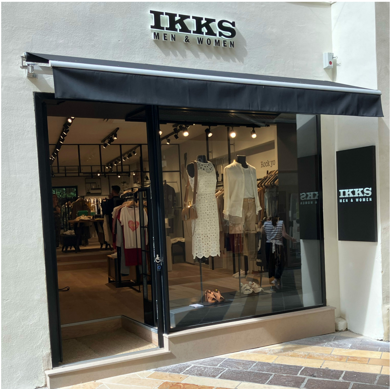
IKKS Men Women, 21 rue des Marchands, Avignon. Ouvert du mardi au samedi de 10h à 19h.