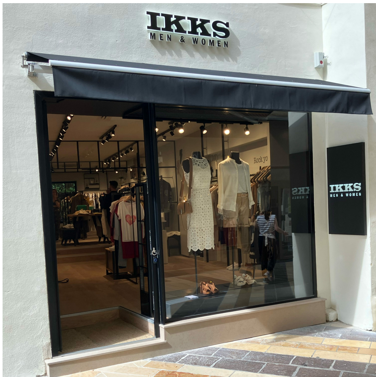
IKKS Men Women, 21 rue des Marchands, Avignon. Ouvert du mardi au samedi de 10h à 19h.