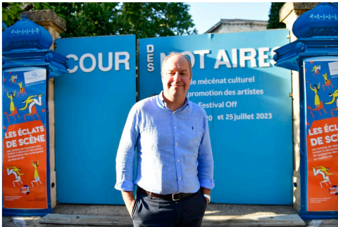
Alexandre Audemard, président de la Chambre des Notaires