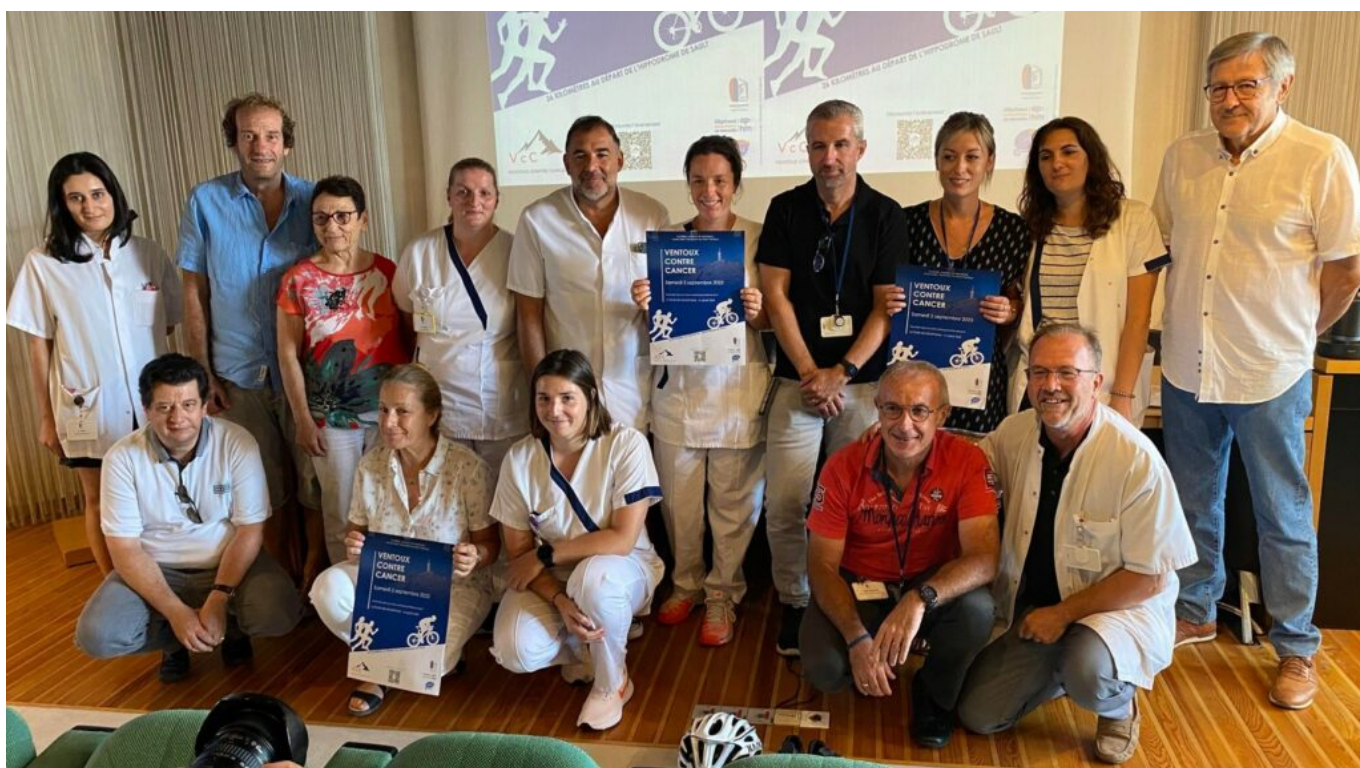
Quelques membres des deux équipes de Sainte-Catherine

Chaque participant doit maintenant collecter des fonds sur le principe du crowdfunding ou financement participatif pour être présent sur la ligne de départ : 275€ minimum par adulte / 100€ par enfant (de 14 à 18 ans), l'entièreté des dons collectés seront attribués au projet 'Guérir du cancer du rectum sans mutilation' de Sainte-Catherine.