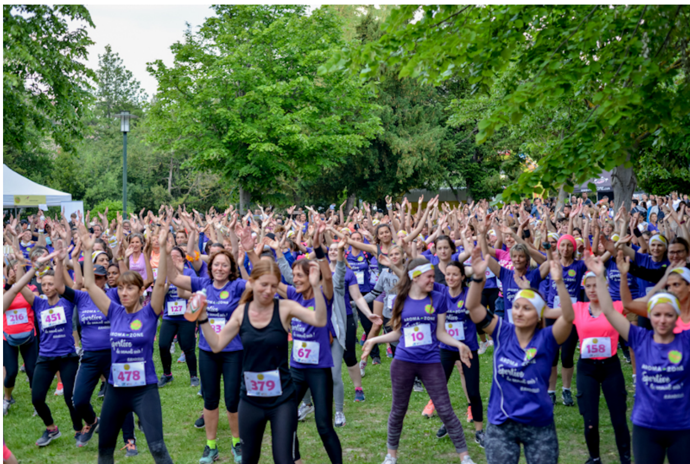
Toutes ensemble !

Parce que les enfants ont aussi le droit de se dégourdir les jambes, la course mixte 'run des kids' est prévue pour les bambins. Place ensuite à la fameuse 'run des filles'. Une course et/ou marche à pied 100% filles, de 2,5km ou 5km (au choix). « Accessible à toutes, sans préjugés, sans stress et sans complexes. En courant ou en marchant, seule ou entre amies, la 'run des filles' est à faire à votre rythme surtout en détente. C'est avant tout un moment de partage dans la bonne humeur, la musique, la convivialité, et le fun autour du sport et de quelques foulées », détaille l'organisation.