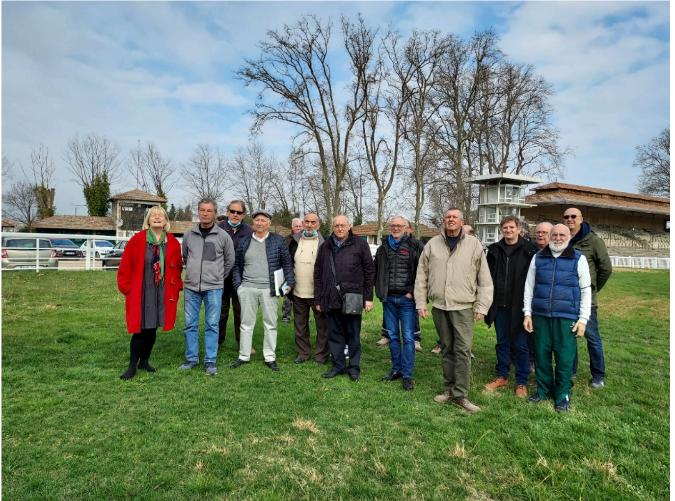
L'équipe des bénévoles entourant le président de la Société hippique d'Avignon-Le Pontet.

Réunions hippiques 2022 à Roberty / Le Pontet : 12 & 28 mars, 10 avril, 2 & 26 mai, 5 & 19 juin.