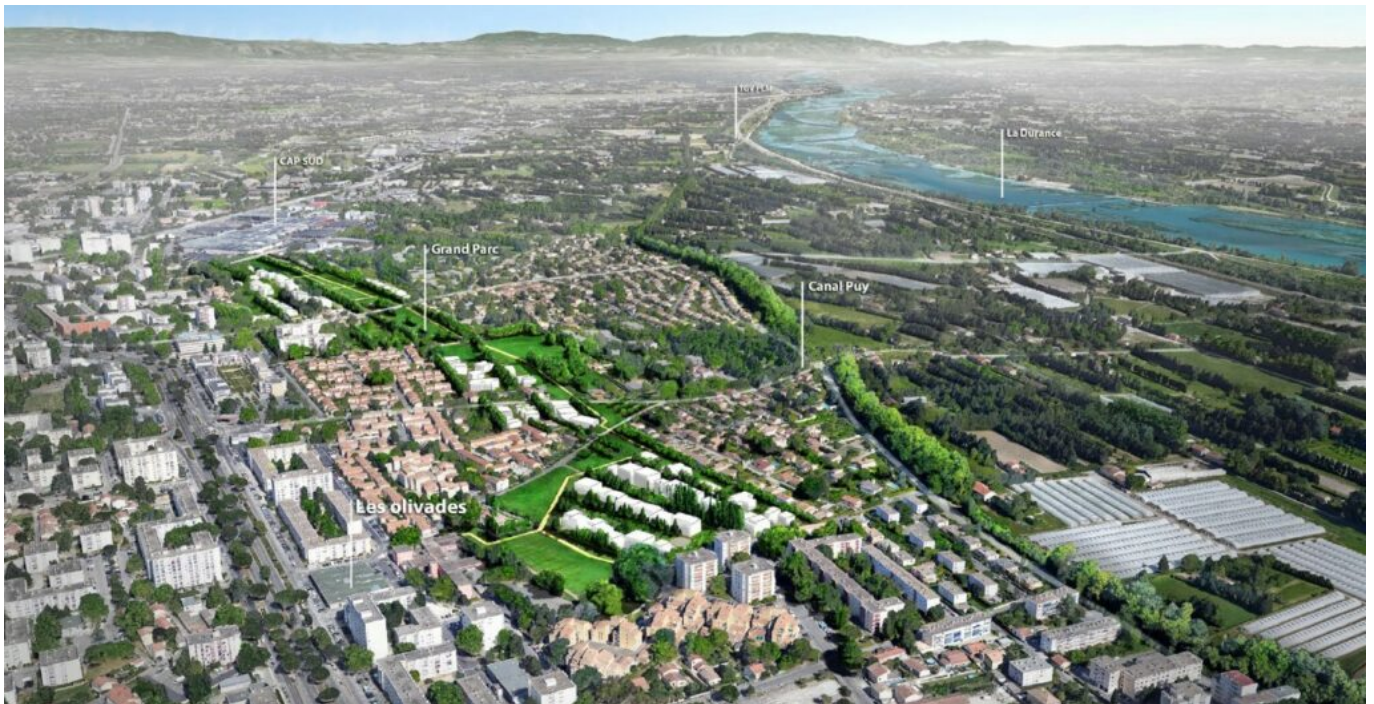
L'éco-quartier de Joly-Jean.