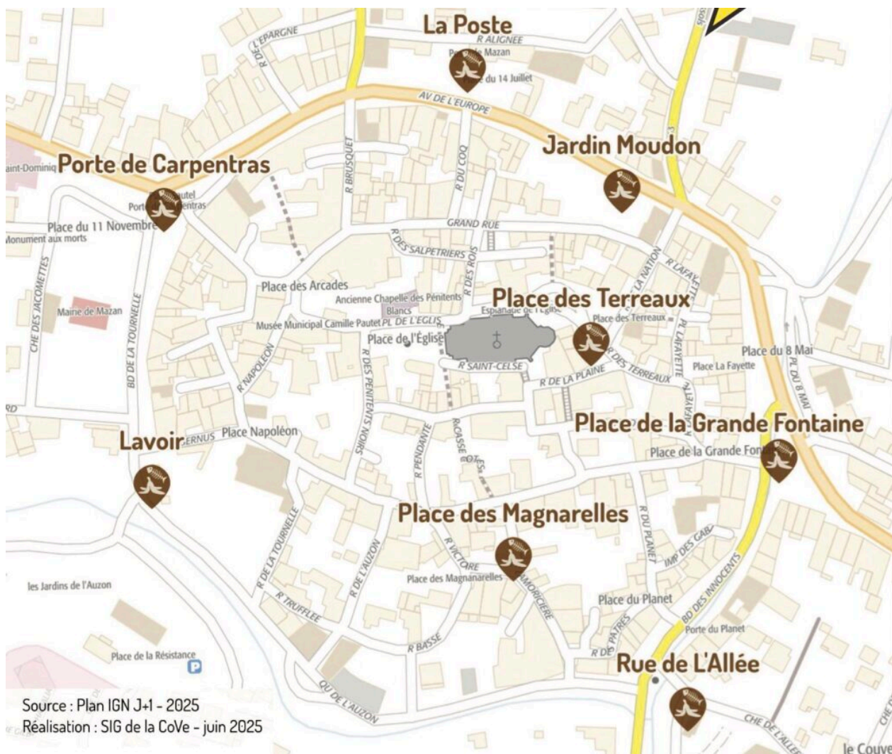
Carte des bornes de biodéchets.

Les habitants peuvent donc y jeter les déchets alimentaires comme les épluchures, les coquilles d'œufs, les sachets de thé et de tisane, les aliments périmés ou non consommés, les restes de repas, etc.