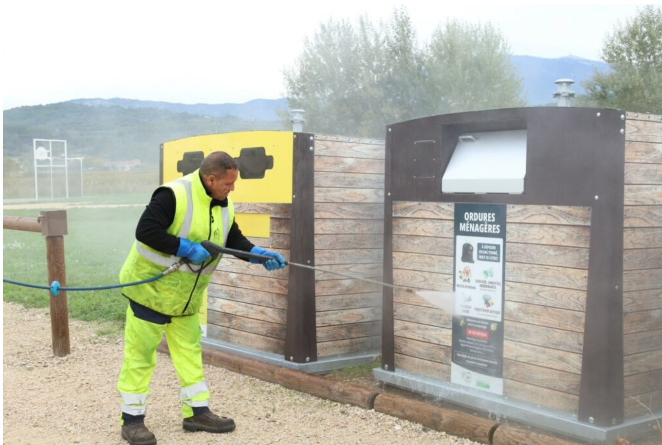
Chaque point de collecte est nettoyé au moins une fois par semaine.