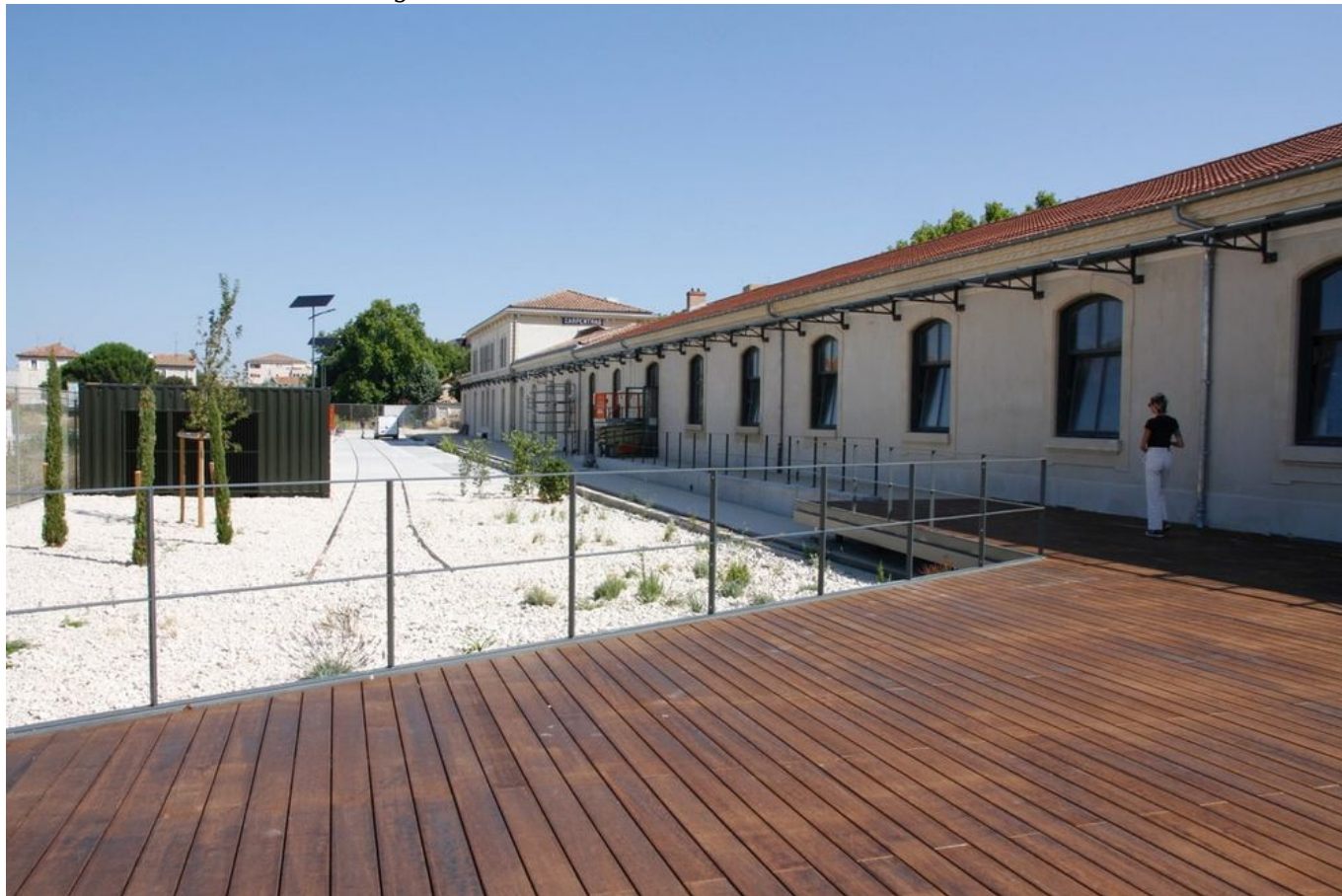
Terrasse Gare numérique.

Bâtiment dédié à la Halle du goût.