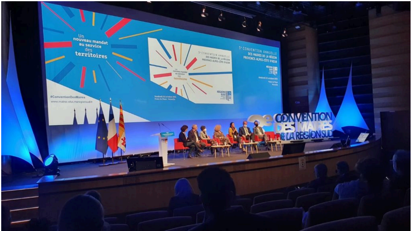
Remise des prix lors de la convention des maires de la Région Sud.

Dans le même sujet : ‘En place’ : deux ingénieurs avignonnais révolutionnent le stationnement en centre-ville