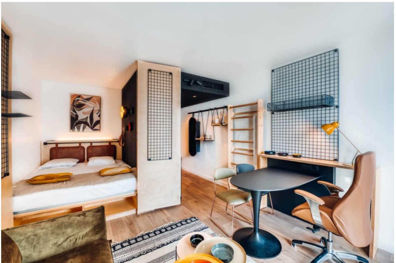
Un exemple de 'flex appart' que l'on peut retrouver à Cowool.