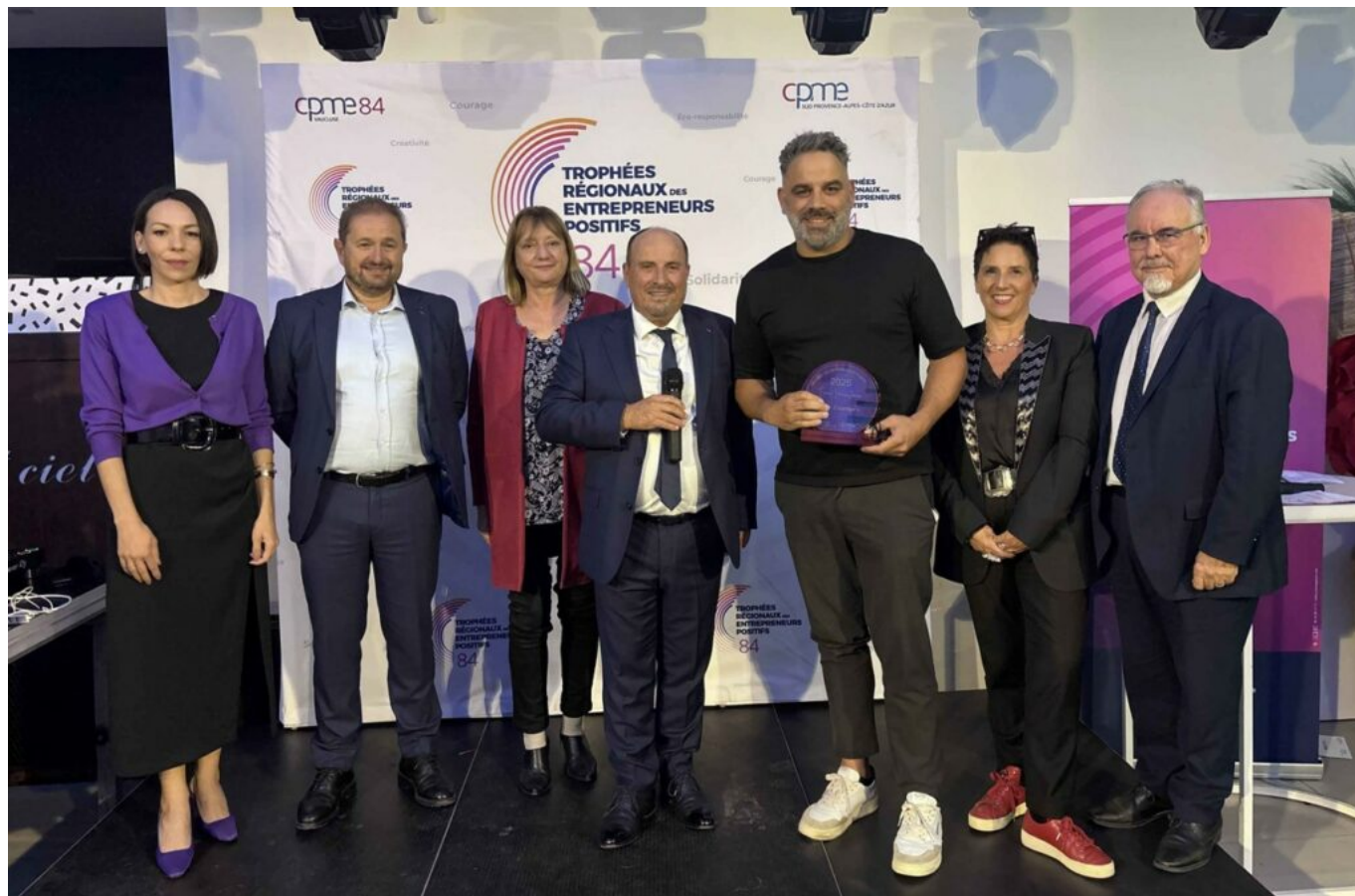
Le prix du courage