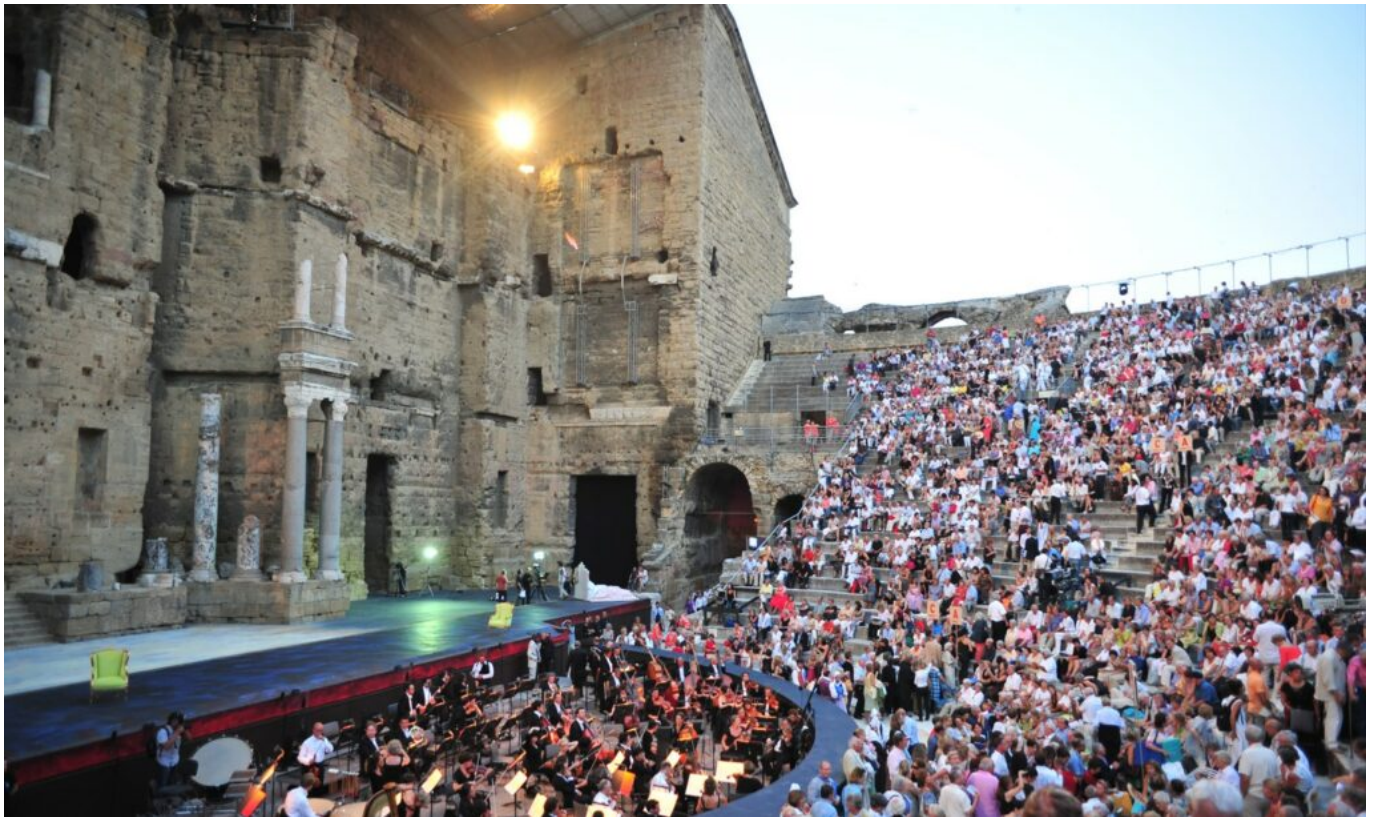
Les spectateurs de la Traviata en 2019.