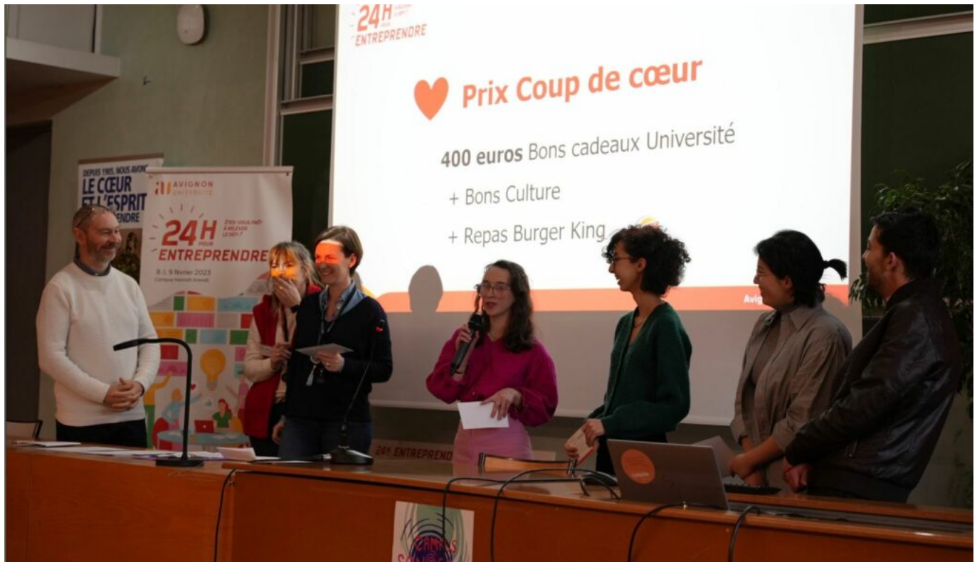
Les étudiants ayant remporté le prix coup de cœur