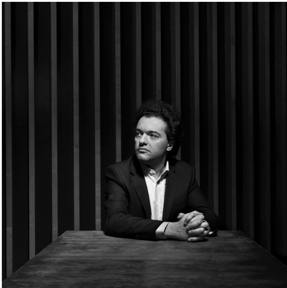
Le pianiste russe Evgeny Kissin.

Comme les Chorégies sont éclectiques et souhaitent chaque année élargir leur audience, elles proposent aussi de la danse le 16 juillet avec le Ballet de la Scale de Milan dont le programme n'est pas encore défini. Du jazz, le 18 avec Eastwood fils, Kyle qui rendra hommage à son papa en interprétant avec son quintet des versions revisitées des bandes originales de films avec saxophone, trompette, contrebasse, guitare basse et batterie.