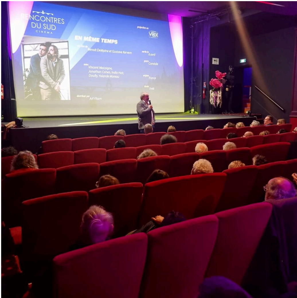
Les Rencontres du Sud en 2018.