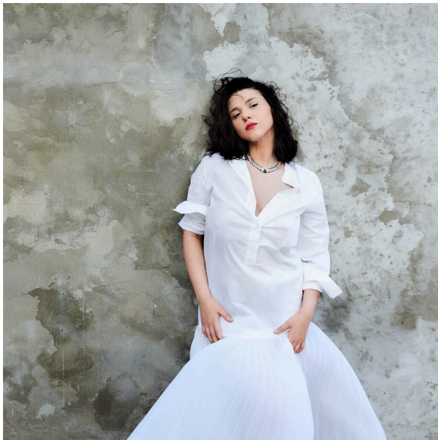
Khatia Buniatishvili.

du piano, Khatia Buniatishvili qui a donné son 1er concert à l'âge de 6 ans. Elle a remporté le Grand Prix Horowitz à Kiev en 2033 puis le Prix du Public au Concours Arthur Rubinstein en 2008. Depuis, elle parcourt la planète pour une carrière internationale et elle viendra pour la 1ère fois aux Chorégies interpréter l'émouvant Concerto pour piano n° 23 de Mozart.