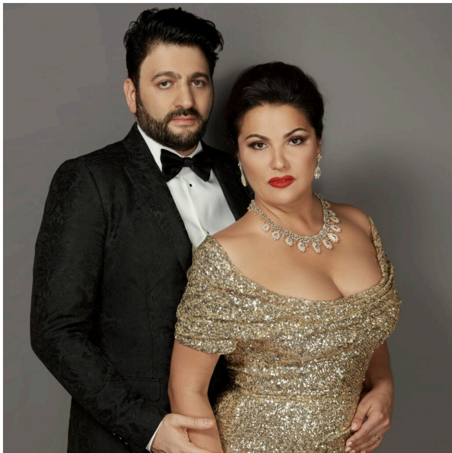
Anna Netrebko et son époux le ténor Yusif Eyvazov.

Enfin les Chorégies souhaitent accueillir des jeunes, c'est la raison pour laquelle, le directeur avec le conseil d'administration soutient des musiciens émergents, ce sera le cas le 13 juillet au Théâtre des Princes. « Allez les voir, les découvrir, ils sont formidables. En ce moment avec la crise tout court et la pandémie, les engagements sont rares, donnez-leur un coup de main ».