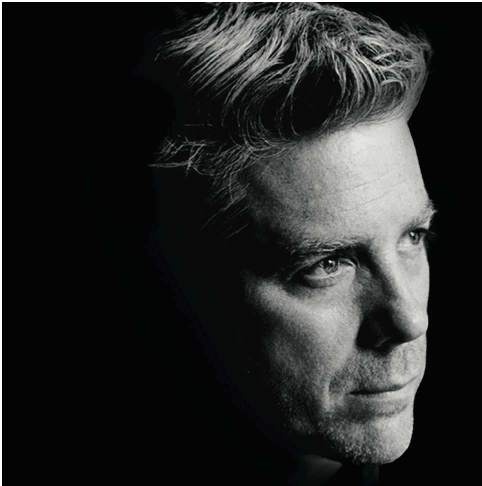
Kyle Eastwood.