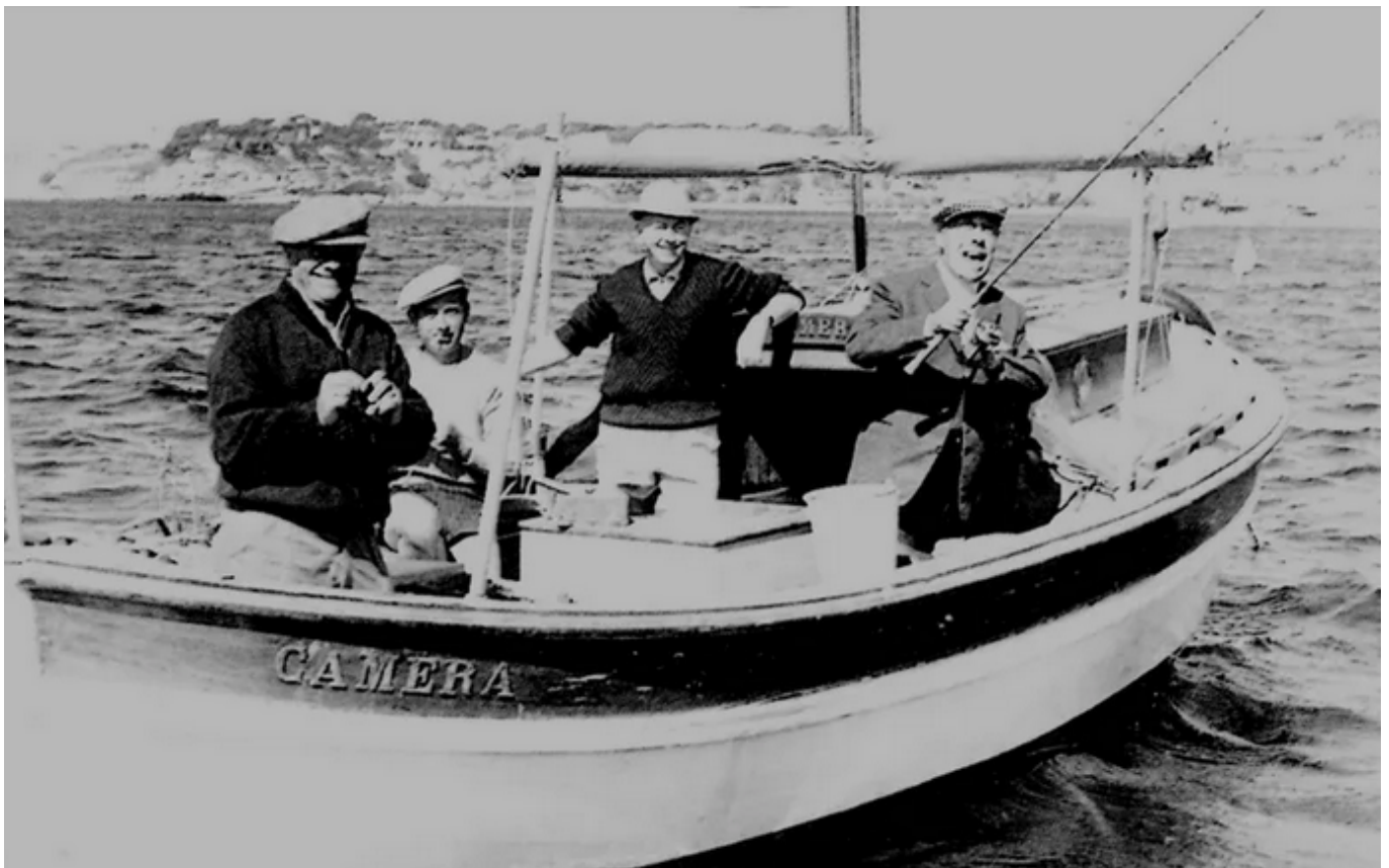
Fernandel (à droite), lors d'une de ses sorties de pêche au large de Carry-le-Rouet.

Depuis, l'Association Culturelle de Carry a racheté ce pointu pour le remettre en état et l'offrir au regard des visiteurs, en souvenir de son citoyen le plus célèbre (que Jean-Pierre Foucault me pardonne) et surtout un amoureux fou de ce petit port de pêche de la Côte Bleue.