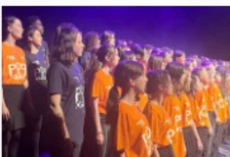
Pop The Opera