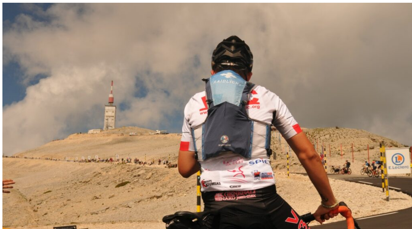
Cyclotouriste avant l'étape de 2021.