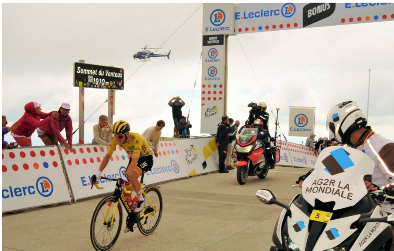
Tadej Pogačar, le maillot jaune, au sommet du Ventoux en 2021.