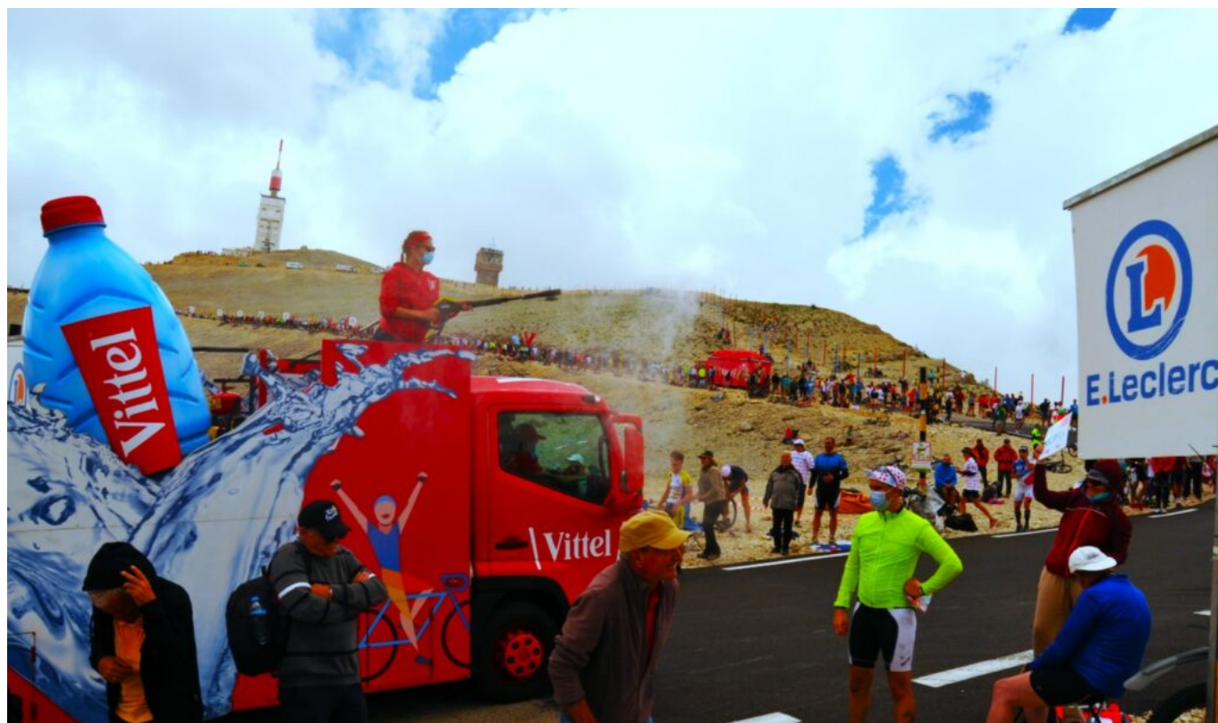
La caravane du Tour de France en 2021.

C'est ce qu'a bien compris le Département de Vaucluse qui y voit l'opportunité de faire la promotion du cyclotourisme sur son territoire. En effet, après chaque présence du Ventoux, les chiffres de fréquentation des cyclotouristes sont en hausse pour atteindre plus de 120 000 cyclistes le gravissant désormais chaque année.