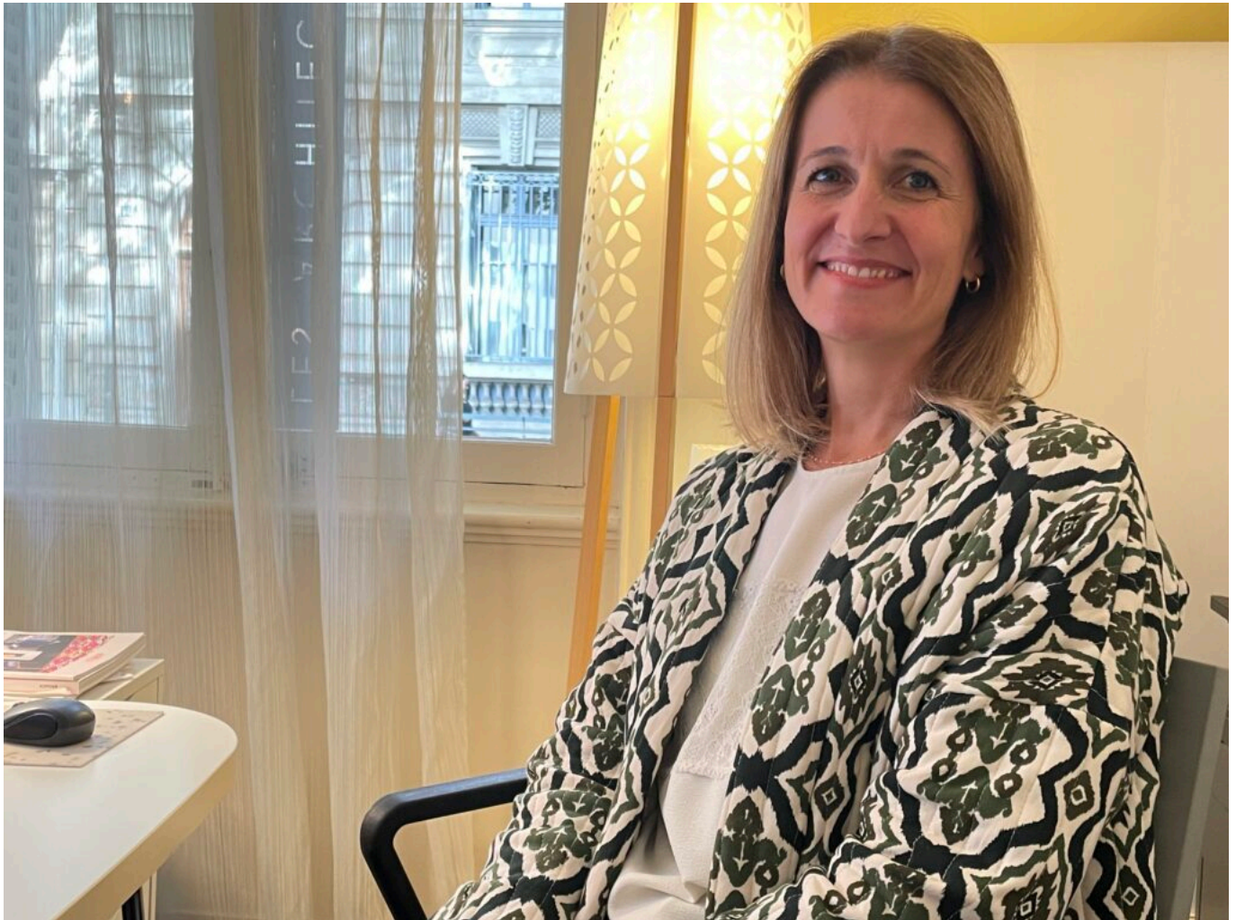
Carole Nègre Copyright MMH