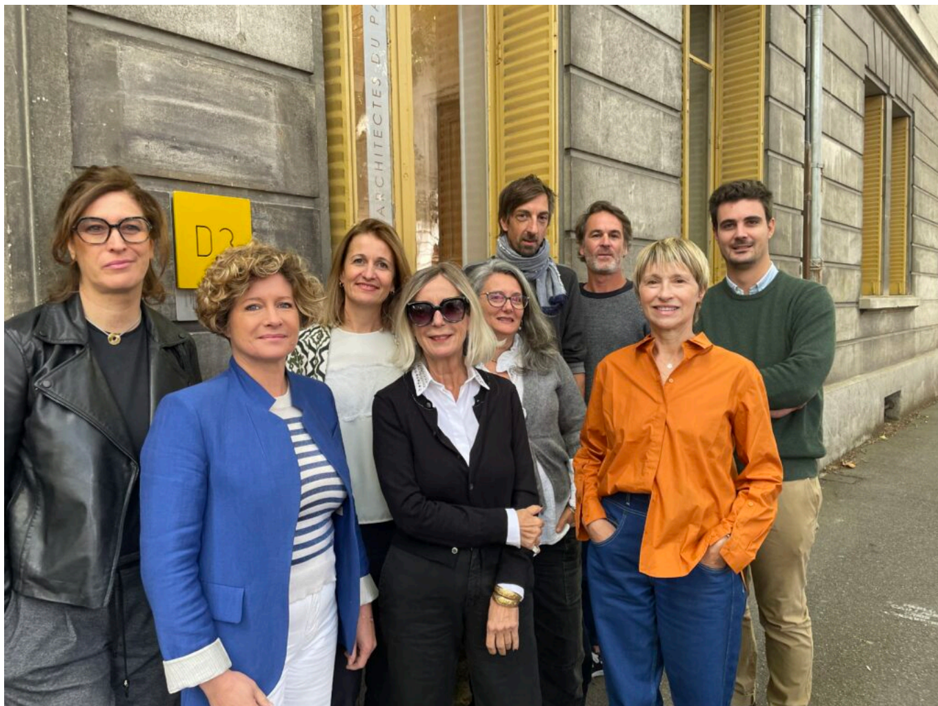
Les coworkers du D3