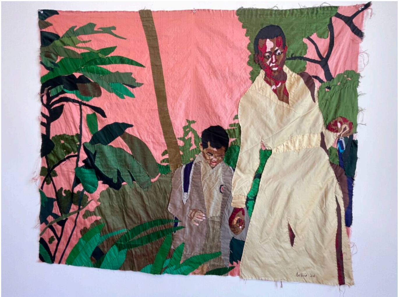
Œuvre de Billie Zangewa, Soldier of love