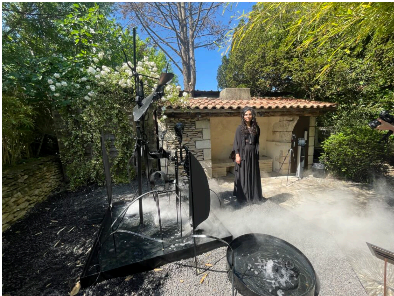
Œuvre de Yosra Mojtahedi 'Volcanahita' Copyright MMH