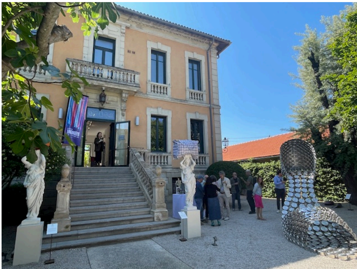
La Villa Datris

Une occasion de (re)découvrir l'exposition Engagées. Visites guidées en août vendredi et samedi à 16h et dimanche 11h. Entrée libre sur réservation. Durée 1h. Réservation ici . Entrée libre et gratuite. 7, avenue des quatre otages à l'Isle-sur-la-Sorgue. 04 90 95 23 70. info@fondationvilladatris.com