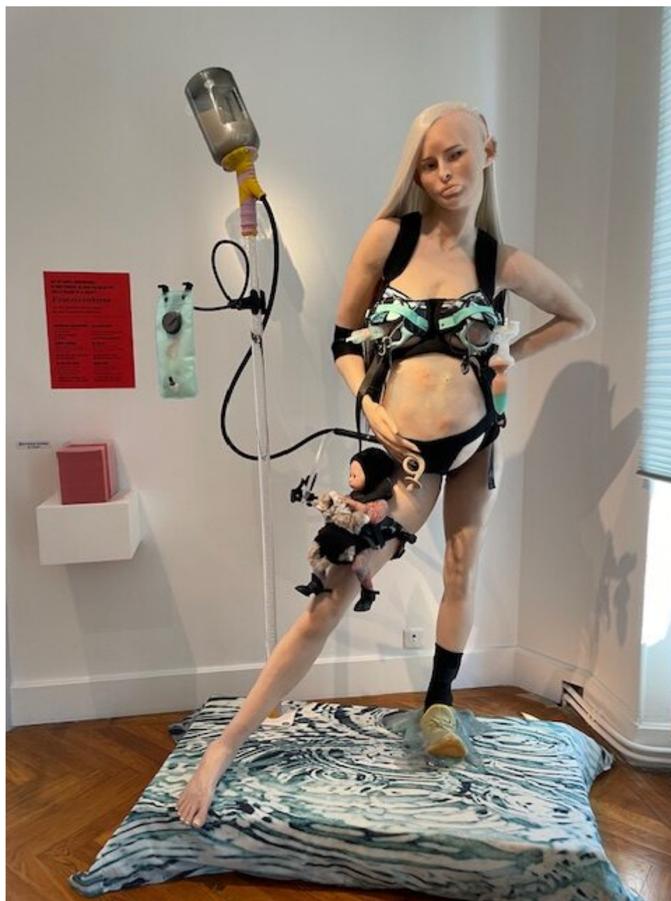
Oeuvre de Cajsa Von Zeipel 'Gay Milk' le corps post-humain comme une industrie humaine