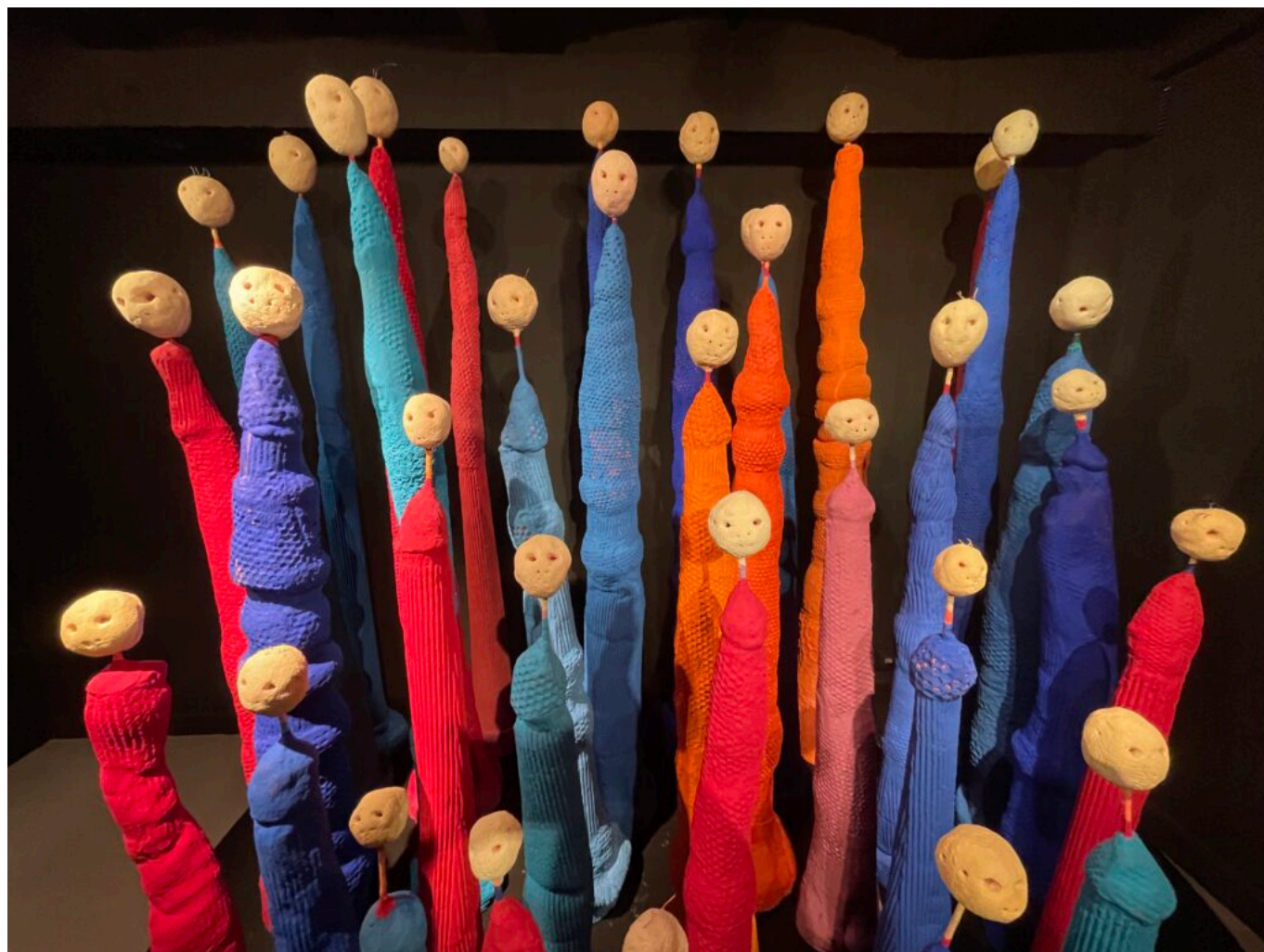
Œuvre de Mâkhi Xenakis, les folles d'enfer de la Salpêtrière Copyright MMH

Vendredis, samedis à 16h et dimanches à 11h.