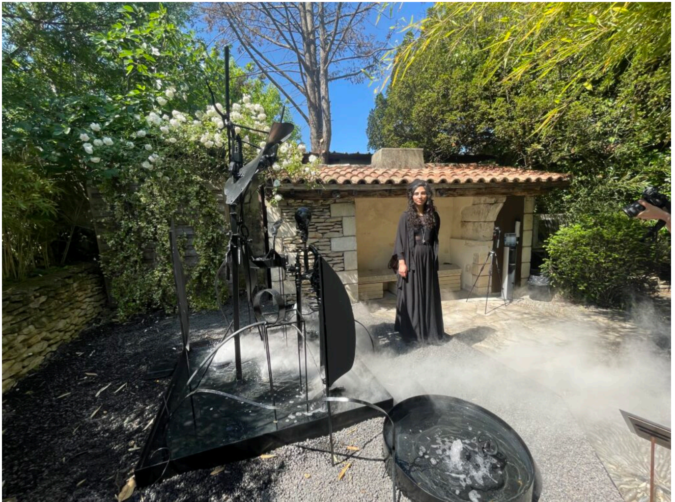
Œuvre de Yosra Mojtahedi 'Volcanahita' Copyright MMH