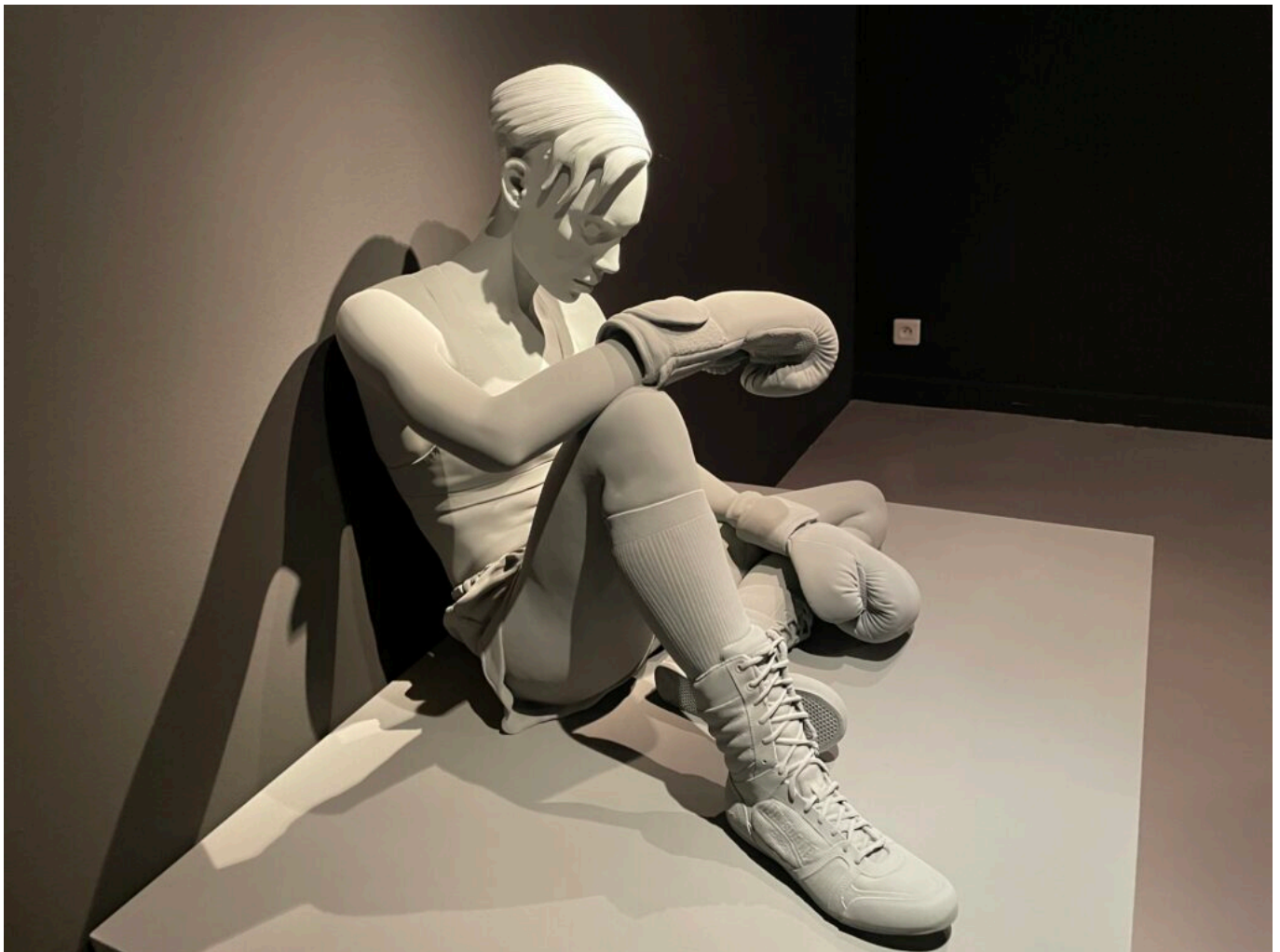
'Hélène' de Hans of Beeck Copyright MMH

On est à la fois tous différents, c'est la raison pour laquelle nous avons montré toutes sortes de corps. Chacun peut s'identifier à son propre corps et pas forcément au corps de l'autre. C'est aussi garder, conserver sa propre identité, son corps intact par rapport au regard de l'autre. Je parlerai là de conserver l'intégrité de son corps, c'est tellement important pour les femmes.»