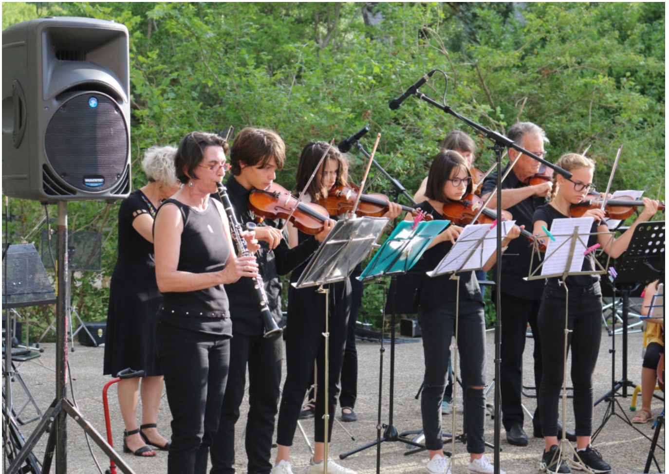
© Ecole de musique et danse Vaison Ventoux