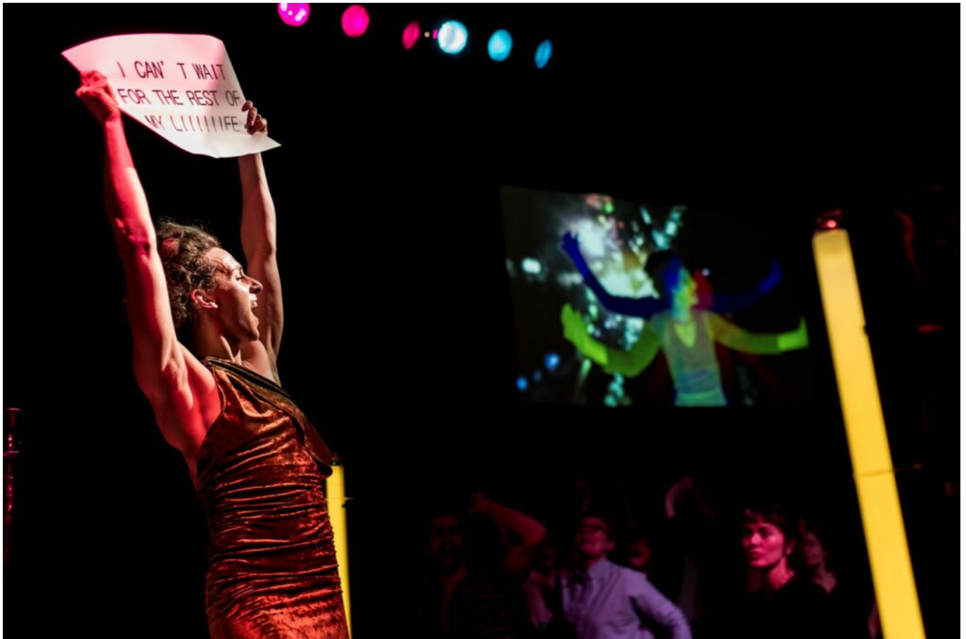
Karaodance Collectif Es-Res