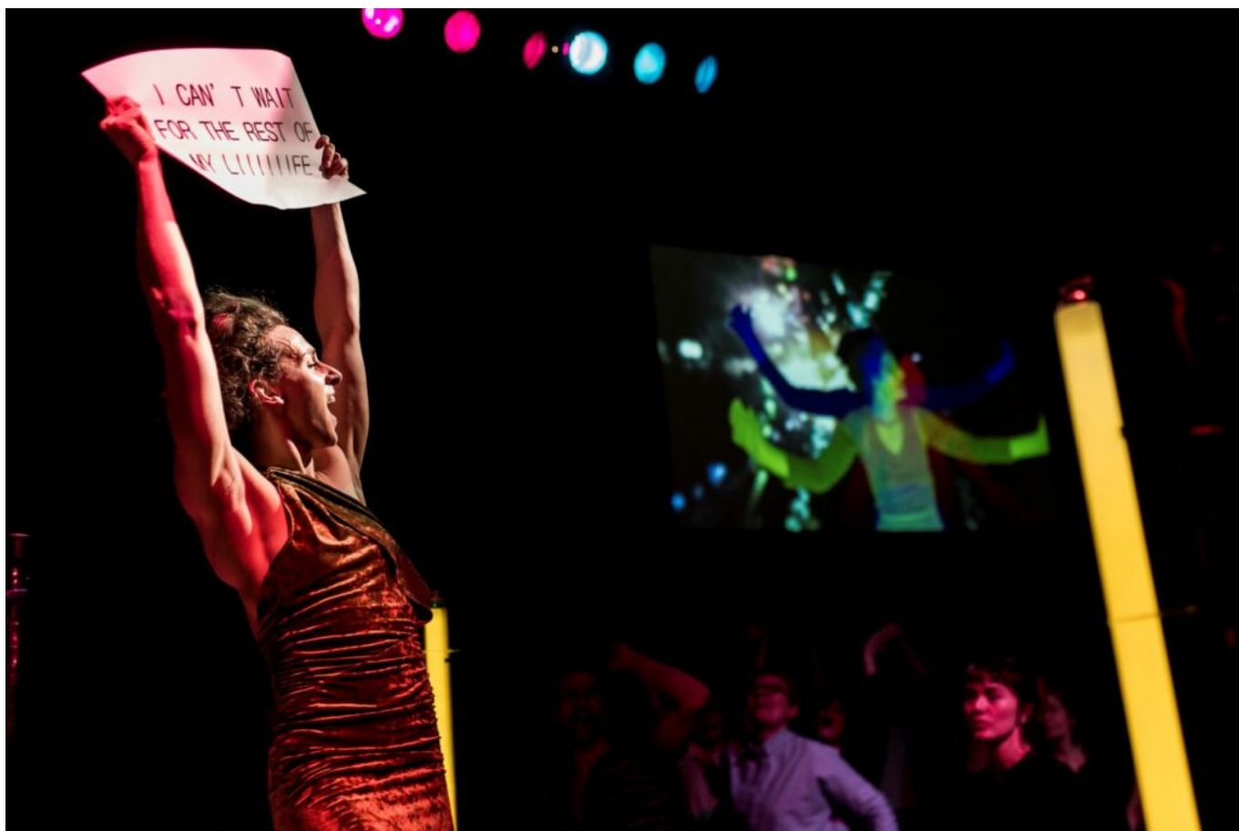
Karaodance Collectif Es-Res