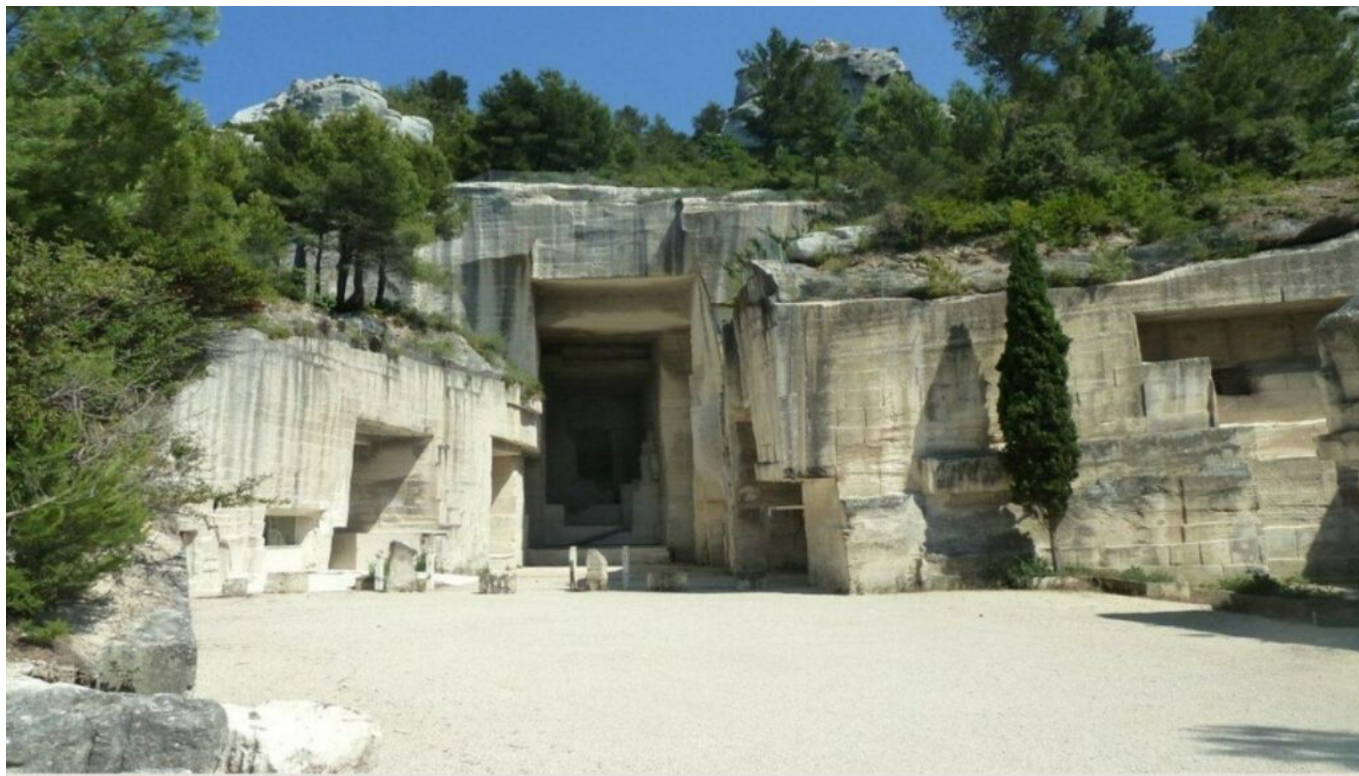
Entrée des Carrières de Lumières DR