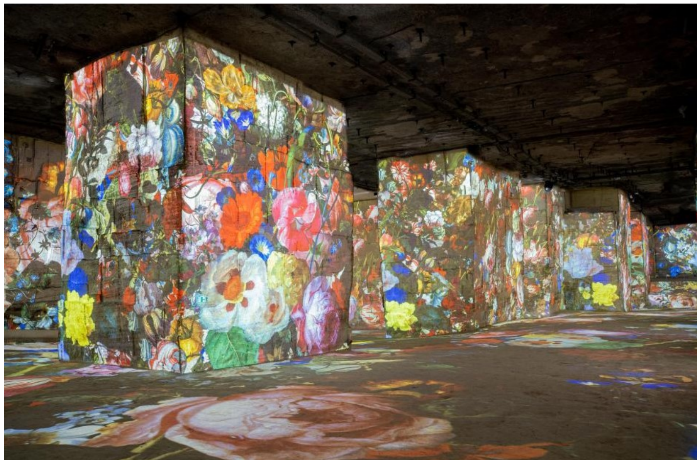
Flower power