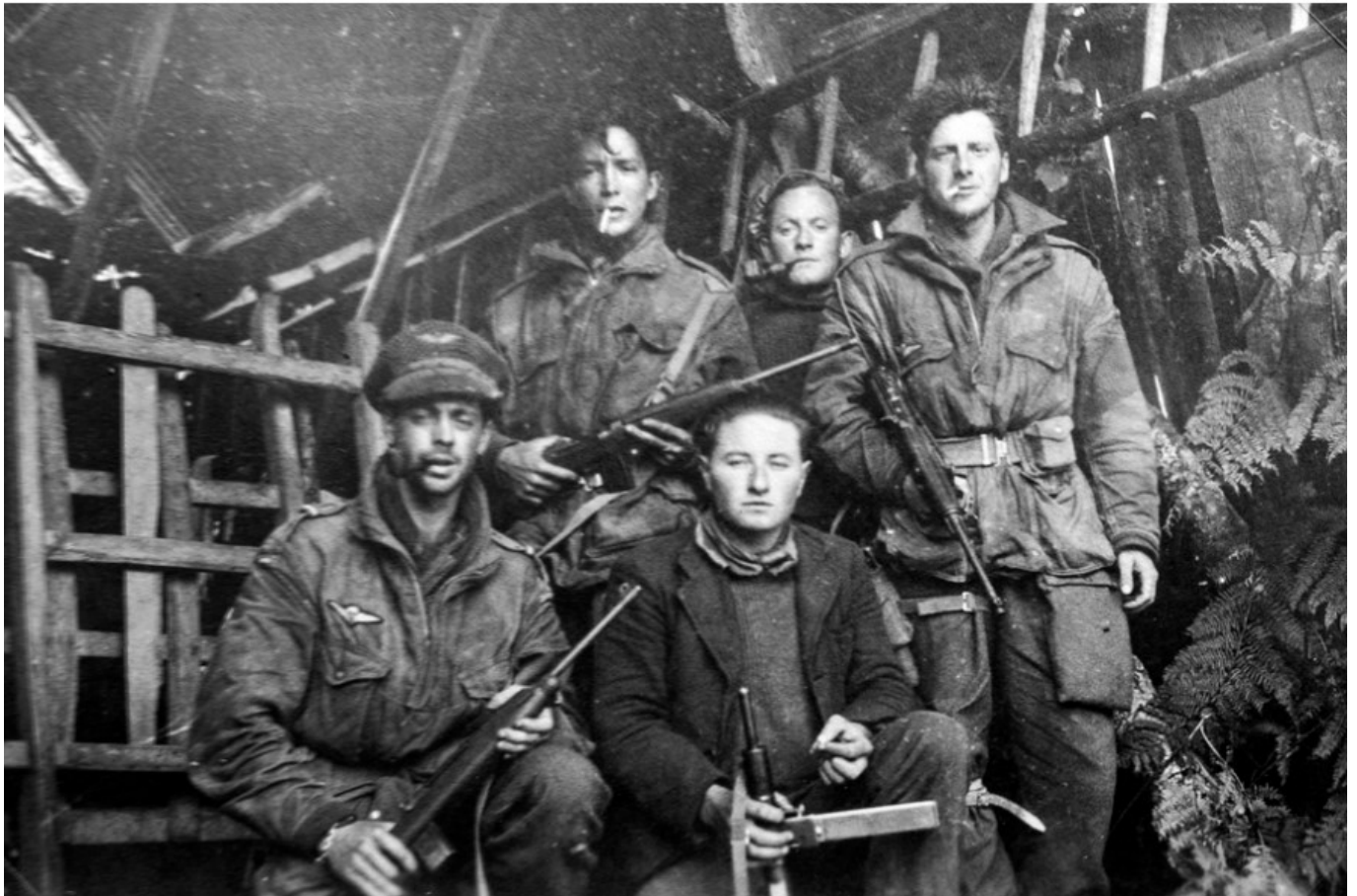
Militaires de l'armée américaine et résistants