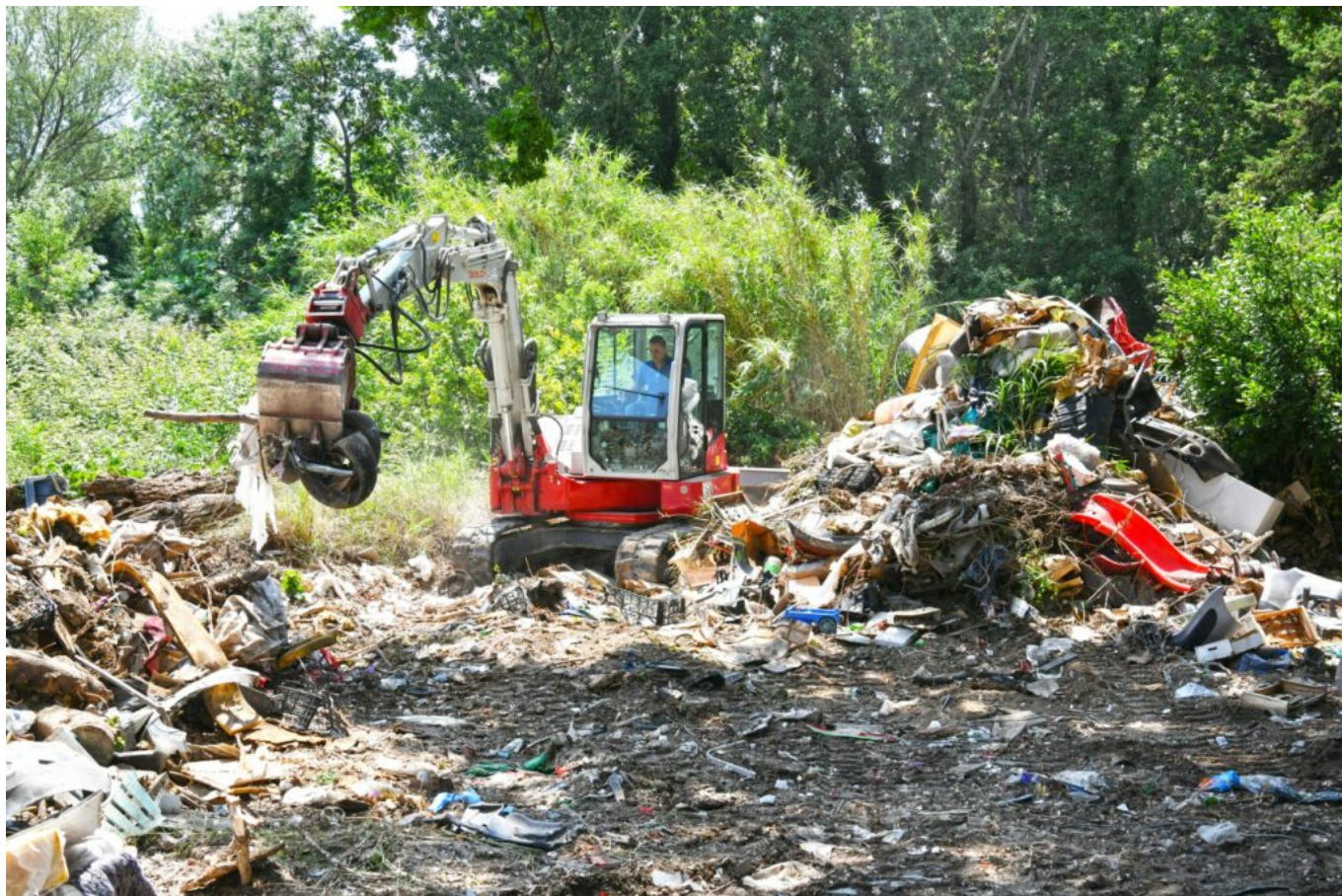
Nettoyage chemin de Baigne-Pied le 12 juin

Gillardeaux, au bord du canal et se poursuivent le long du chemin qui conduit au Lavarin, juste derrière l'hôpital. Pour rendre ce quartier propre et limiter la pollution, le Département de Vaucluse et la ville d'Avignon ont adopté des dispositions consistant en un enlèvement des déchets et à la fermeture de la voie aux véhicules motorisés. Le Département s'est également engagé à nettoyer les parcelles bordant le chemin de Baignes-Pieds, parcelle de 3,4 ha dont il est le propriétaire.