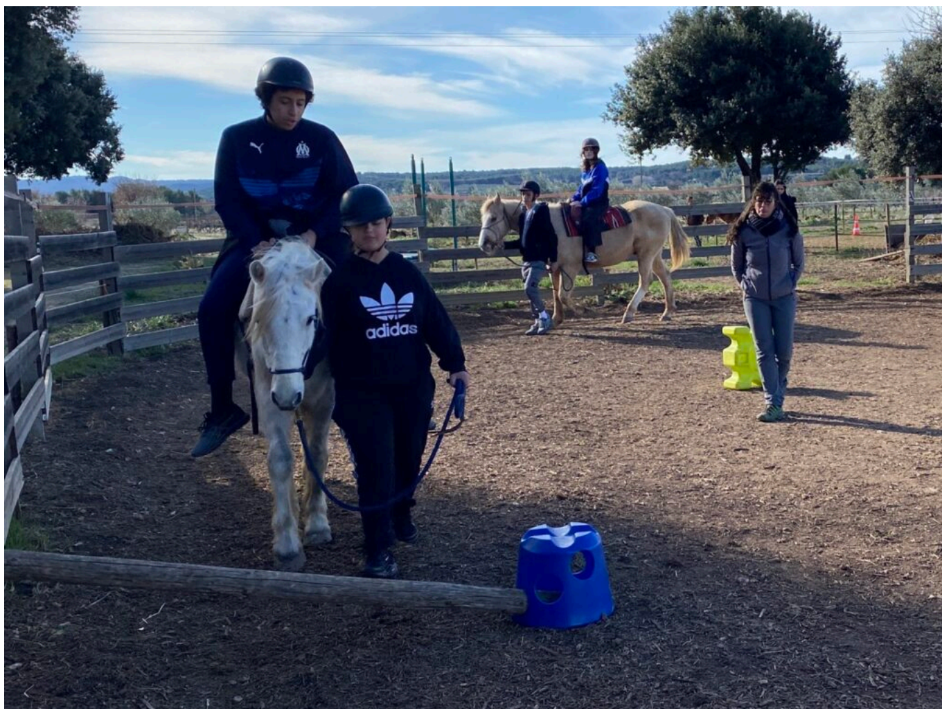
Les jeunes du Micro collège en séance d'équihomologie au Lucky Horse à Mazan.