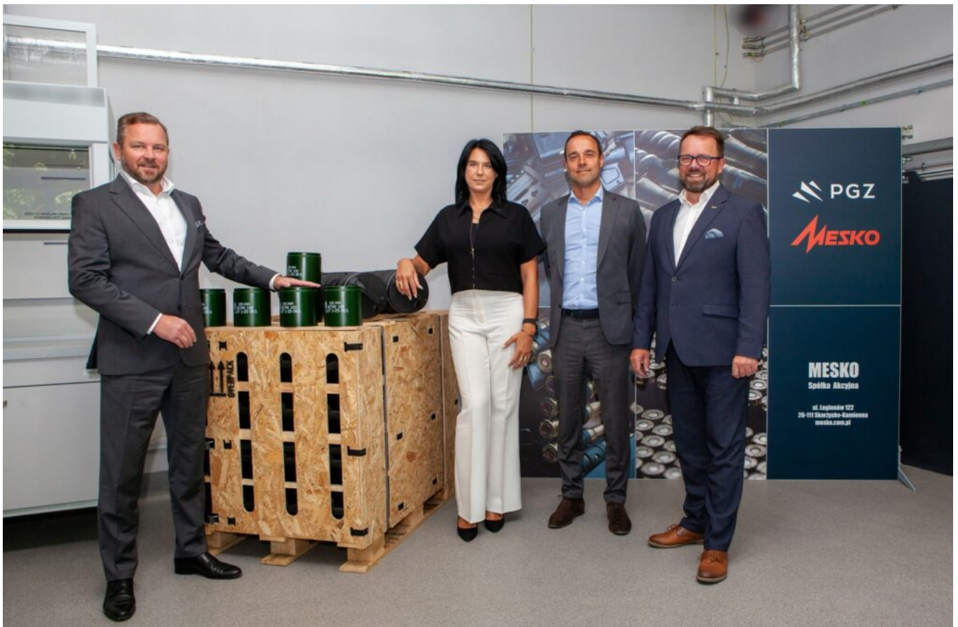
Les responsables de la société polonaise Mesko.