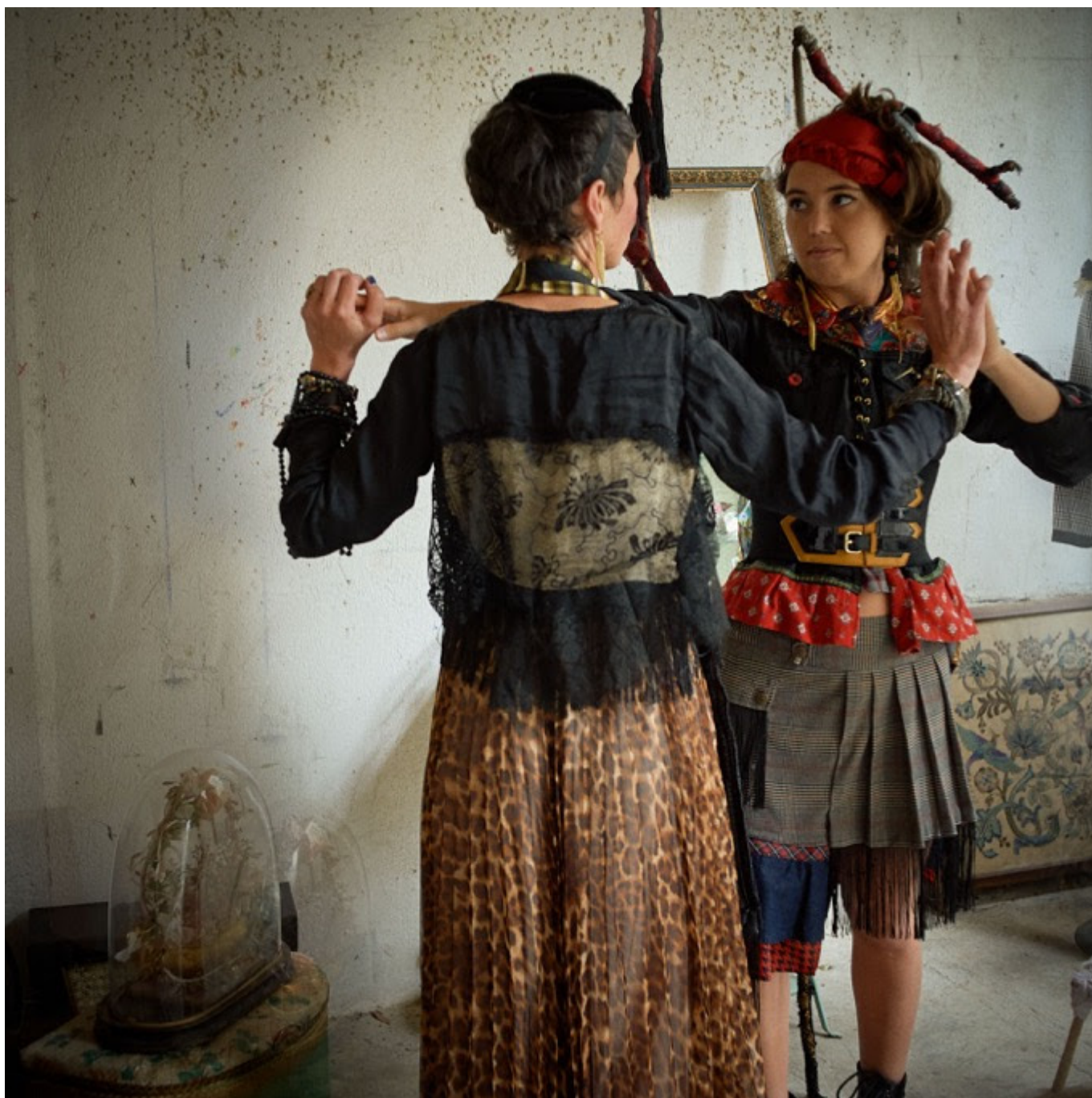
Photo « Ange ou démon » Collection Madame sans Gêne » par Gérard Rouxel