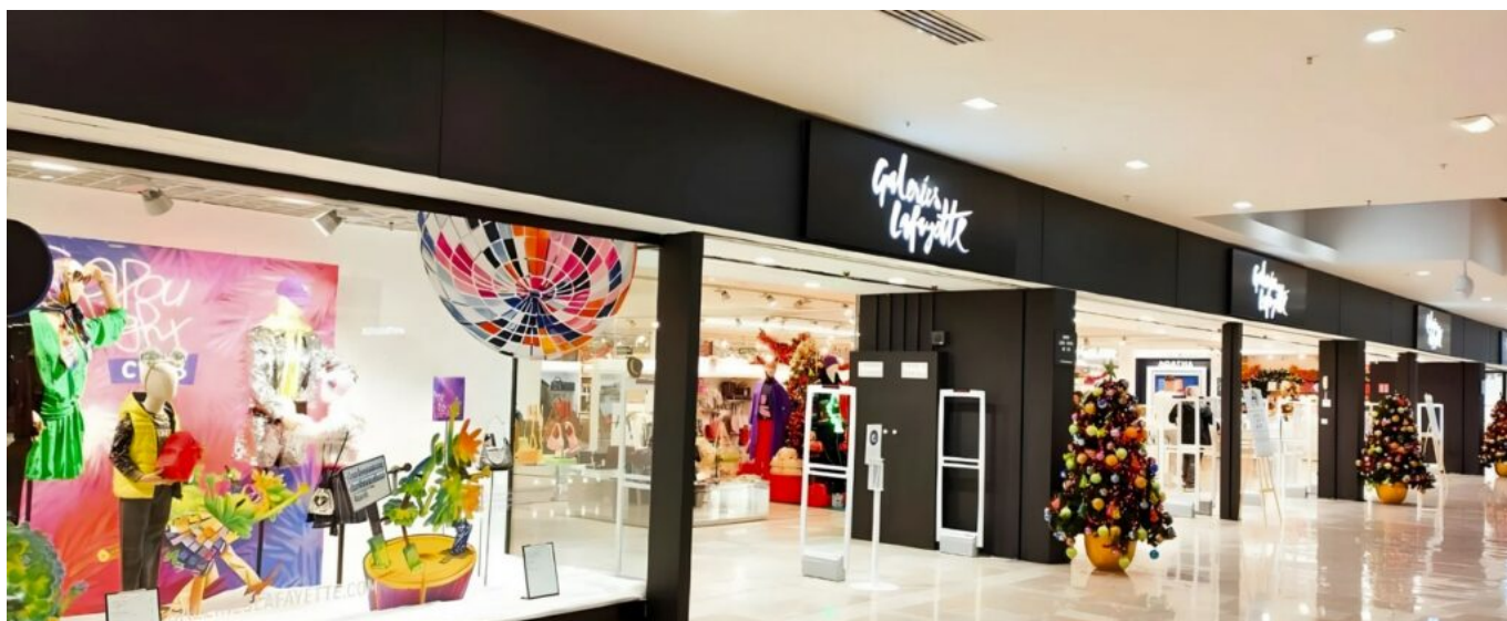
Le magasin d'Avignon situé dans le centre commercial Cap Sud.