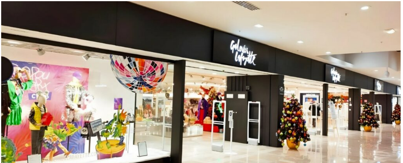
Le magasin d'Avignon situé dans le centre commercial Cap Sud.